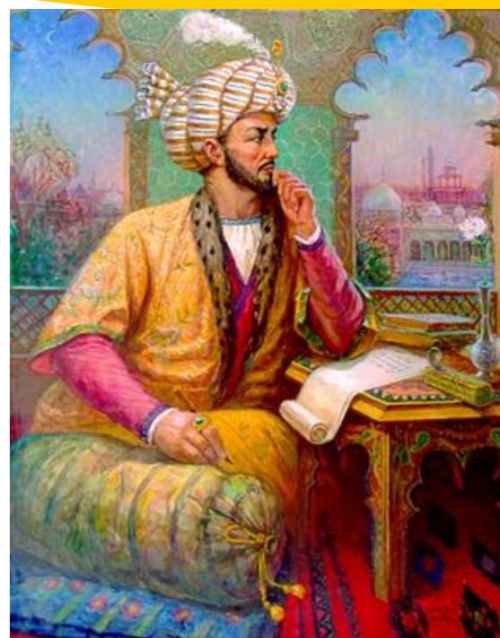
Бабур – основатель империи Великих Моголов

Падишах – название императора в империи Великих Моголов.