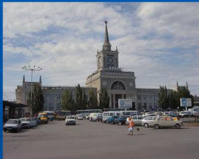
Вокзал на станции Волгоград-I