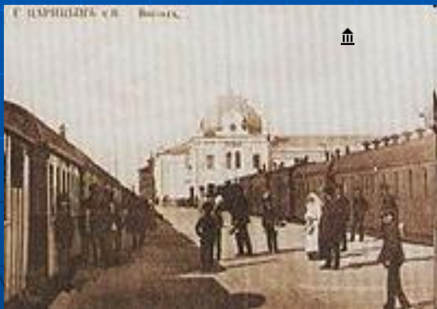
Перрон на станции «Царицын»

Волгоград I — железнодорожная станция Волгоградского отделения Приволжской железной дороги, центральный вокзал Волгограда. Расположен на территории Центрального района по адресу: Привокзальная площадь, 1. Обслуживает как пригородные поезда, так и поезда дальнего следования. Станция является узлом пяти направлений: на Краснодар, Ростов-на-Дону, Москву, Саратов и Астрахань