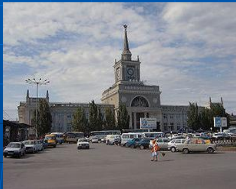
Вокзал на станции Волгоград-I