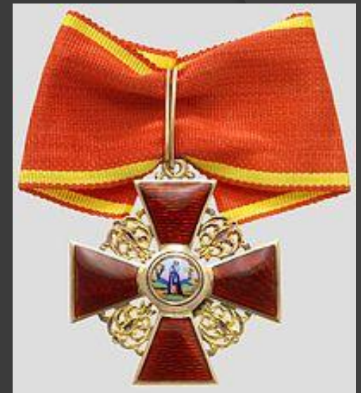
Орден Святой Анны