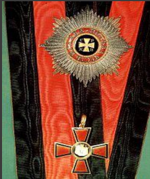
Орден Святого Владимира; Императорский Орден Святого Равноапостольного князя Владимира