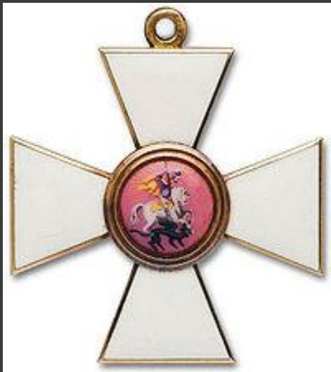
Орден Святого Георгия