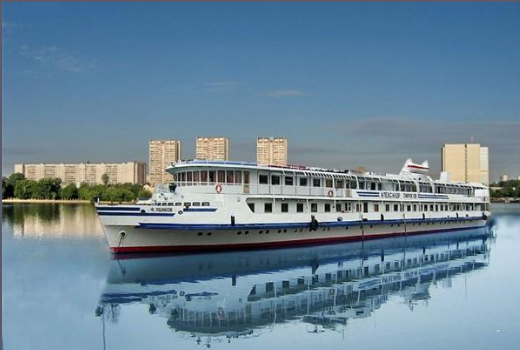
Теплоход «Адмирал Ушаков»