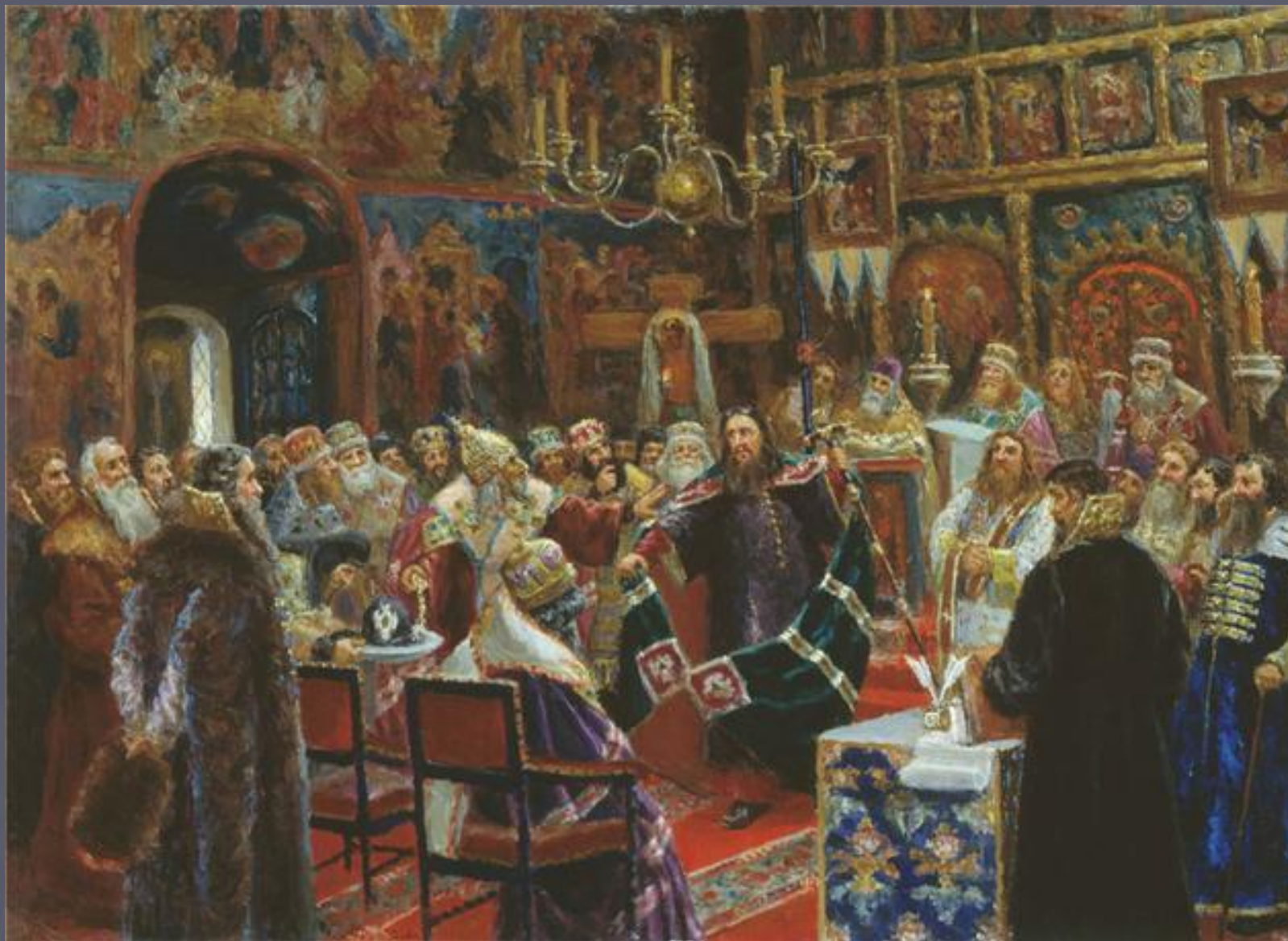
Суд над патриархом Никоном