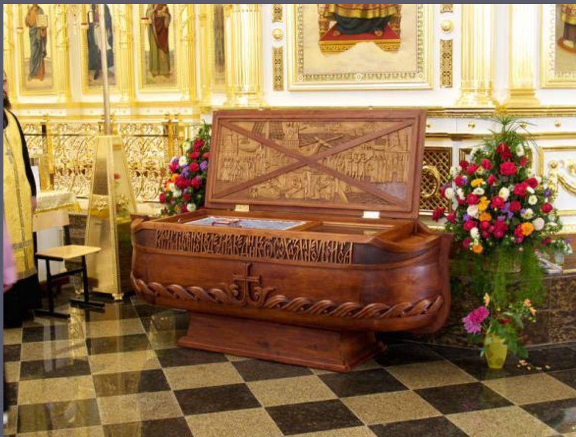
Мощи Адмирала Ф. Ушакова в кафедральном соборе в Саранске