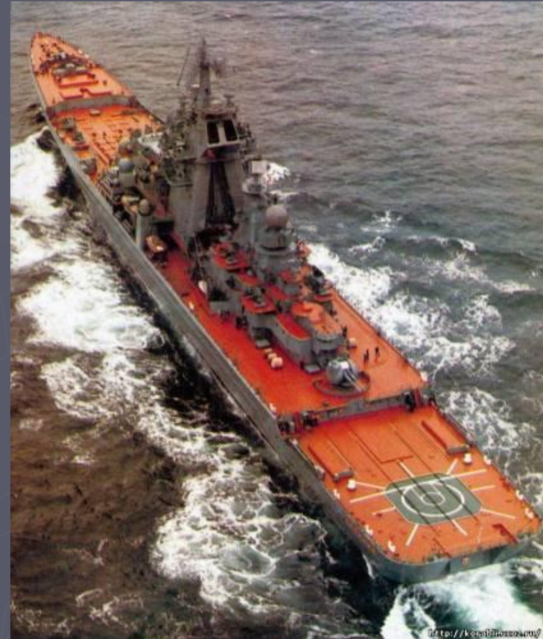
Крейсер «Адмирал Ушаков»