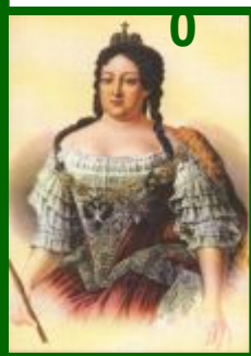
Анна Иоаннов на 1730-1740