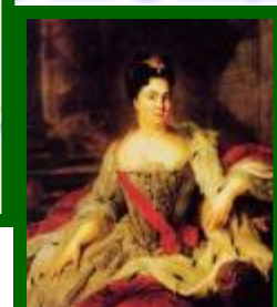
Екатери на I 1725-1727