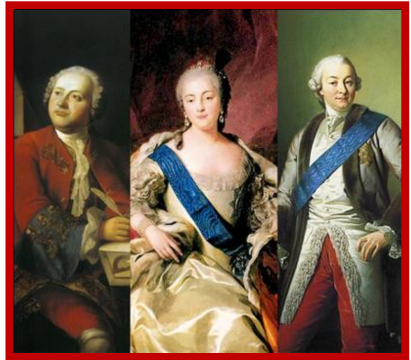
Михаил Васильевич Ломоносов, императрица Елизавета Петровна, Иван Иванович Шувалов.