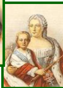
Иван VI Антонович и Анна Леопольдовна 1740-1741