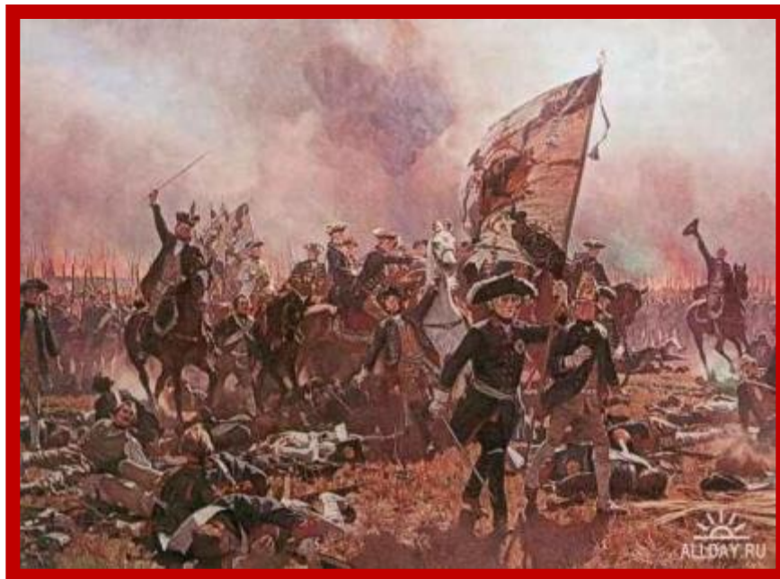
Сражение у Цорндорфа

1761 г. – смерть Елизаветы Петровны. Петр III заключил с Фридрихом II союз против своих бывших союзников и вернул Пруссии все завоевания.