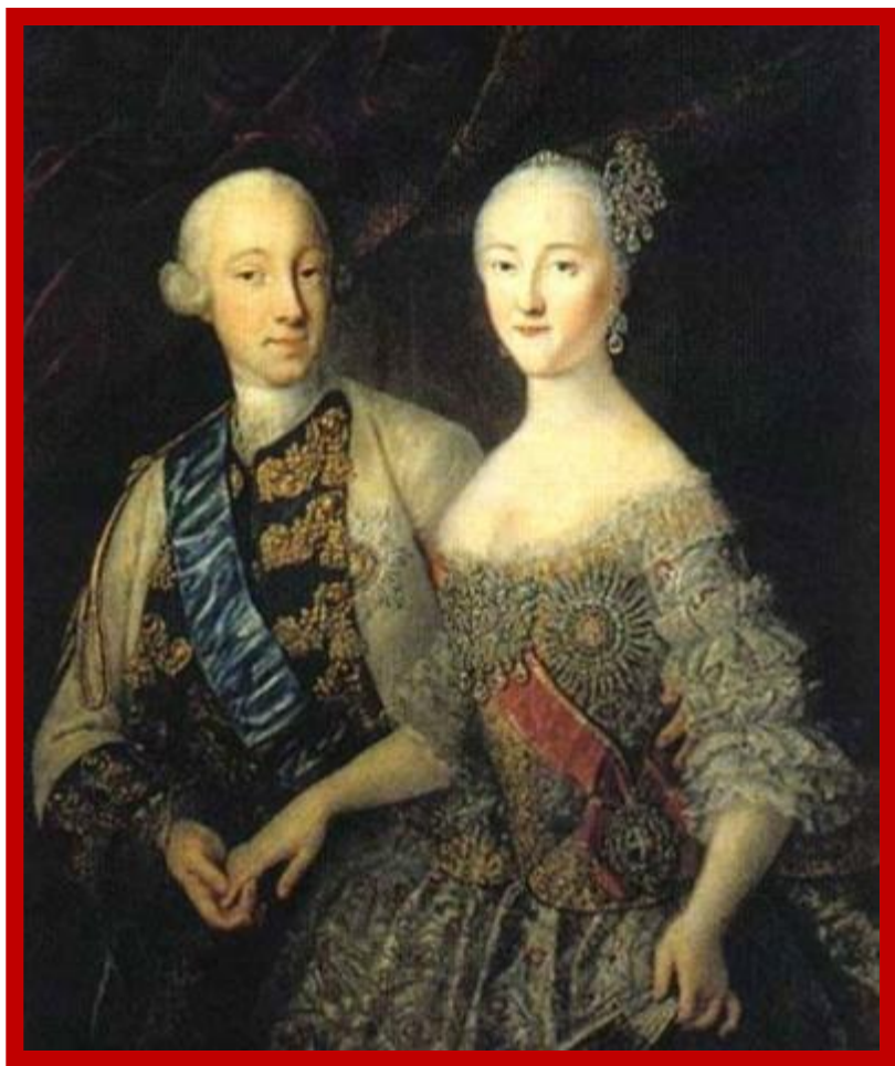
Петр Федорович, великий князь, Екатерина Алексеевна, великая княгиня.