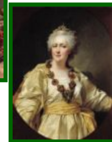
Екатерина II 1762-1796