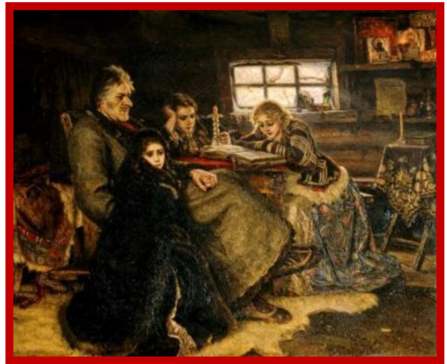
Суриков В.И. Меньшиков в Березове.

Петр II и цесаревна Елизавета на псовой охоте.