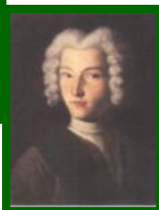
Петр II 1727-1730