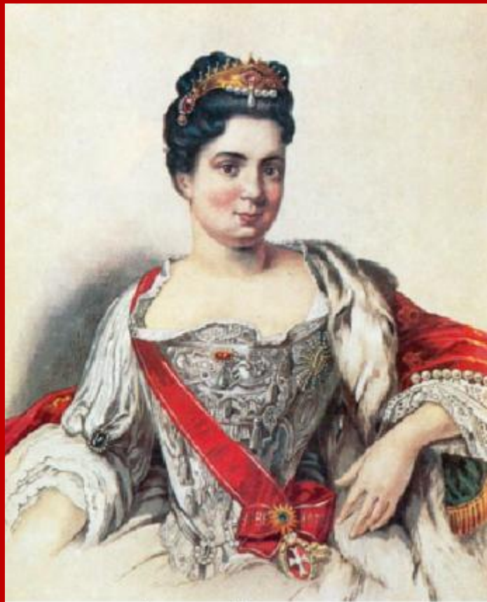
Екатерина I Алексеевна. (1684-1727)