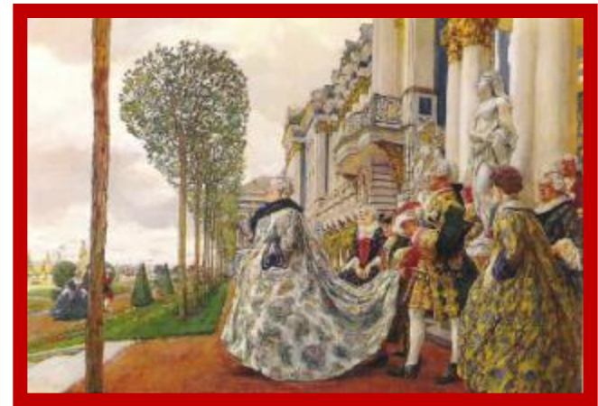
Императрица Елизавета Петровна в Царском Селе Е. Е. Лансере