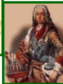
Петр III 1761-1762