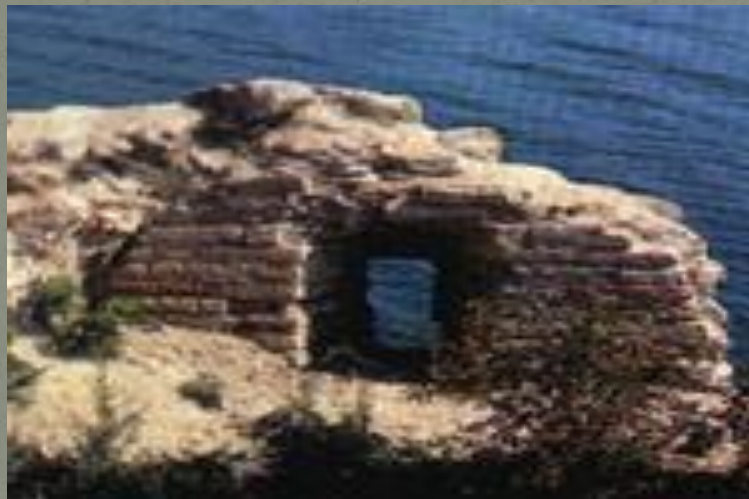
(Бойница Раскатной башни.)