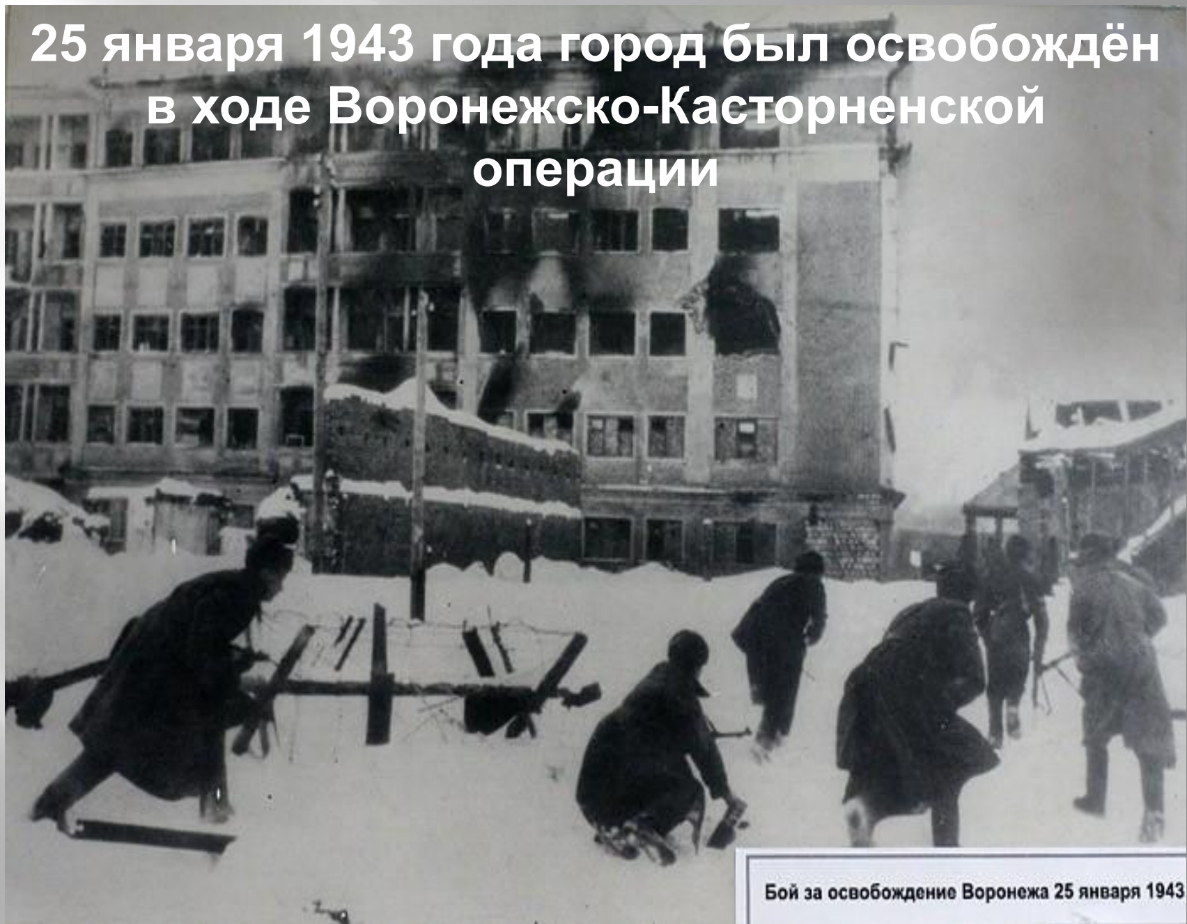
Бой за освобождение Воронежа 25 января 1943