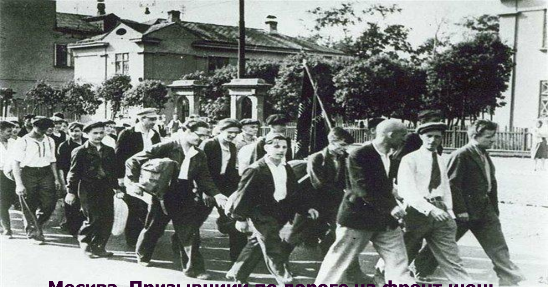
Москва. Призывники по дороге на фронт июнь 1941 года