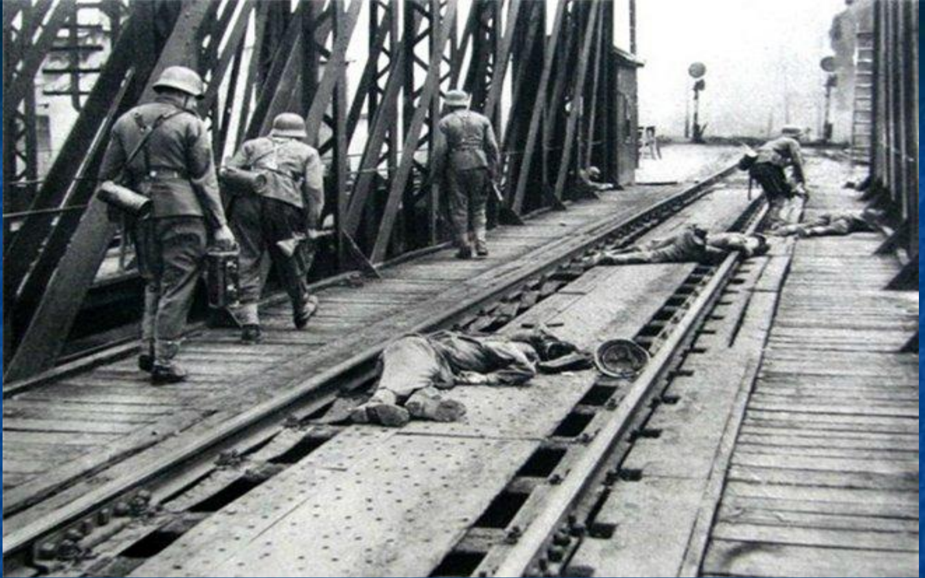
22 июня 1941 года мост в Перемышле