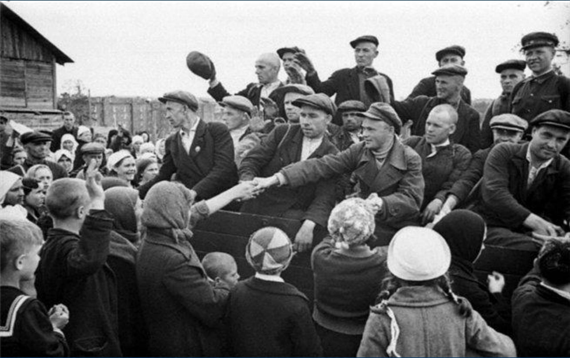
Московская область проводы на фронт июнь 1941