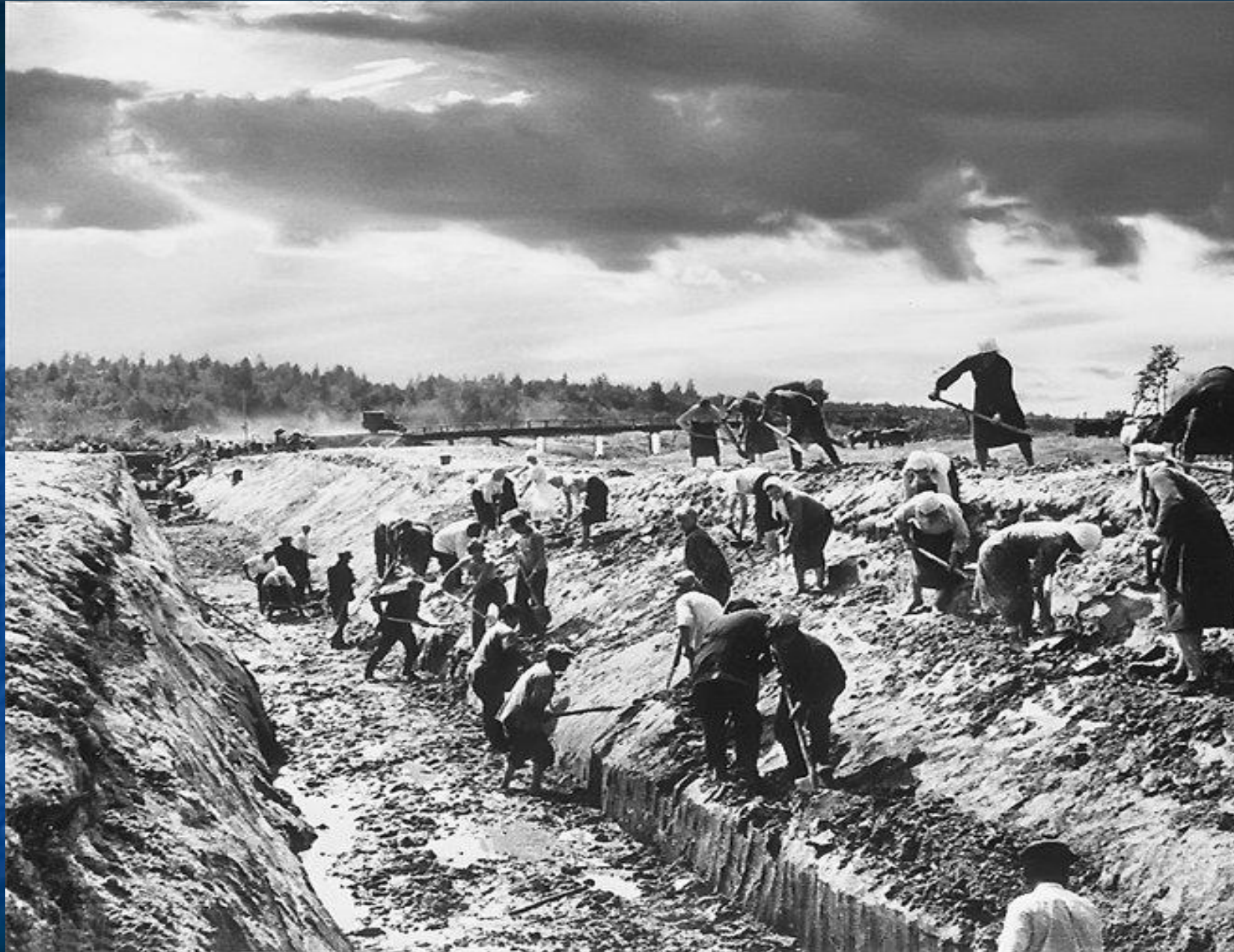
Рытье окопов гражданским населением июнь 1941 года