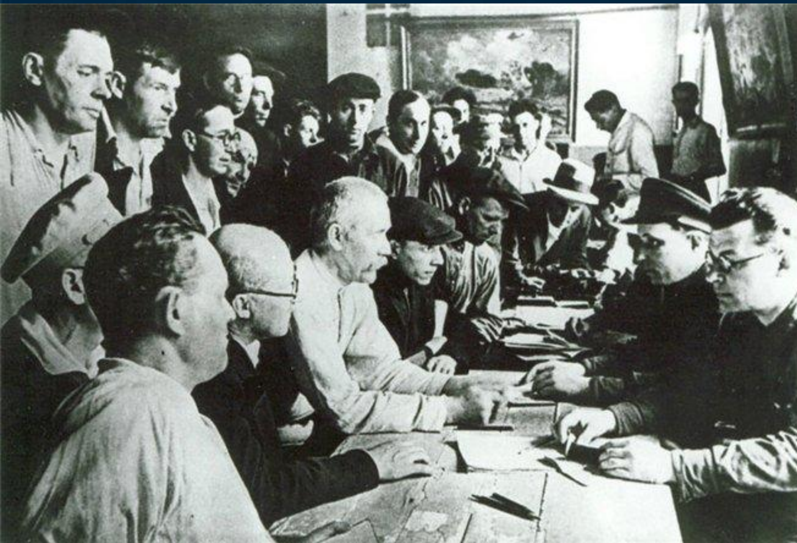
Ленинград Запись добровольцев на фронт июнь 1941