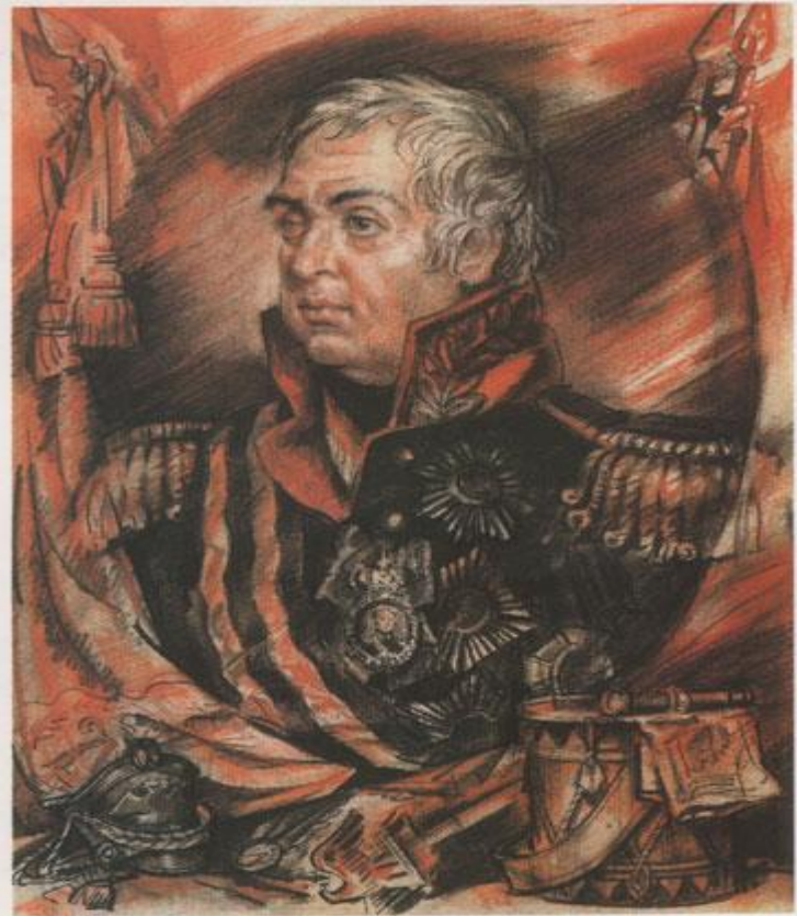
Михаил Илларионович Кутузов 1745—1813

Имя великого русского полководца Михаила Илларионовича Голенищева-Кутузова неотделимо от Отечественной войны 1812 года. Именно в этот завершающий период своей жизни он полностью проявил себя как стратег, государственный деятель, возглавивший народную войну против иноземных захватчиков.