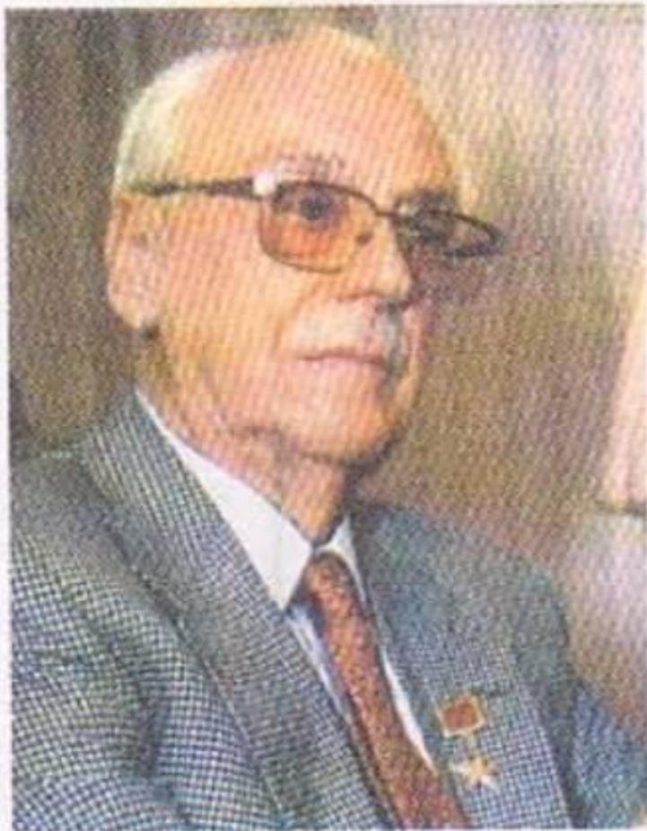
С. В. Михалков