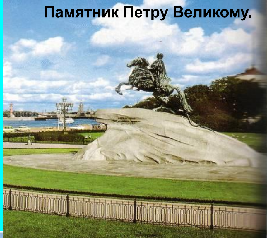
Памятник Петру Великому.