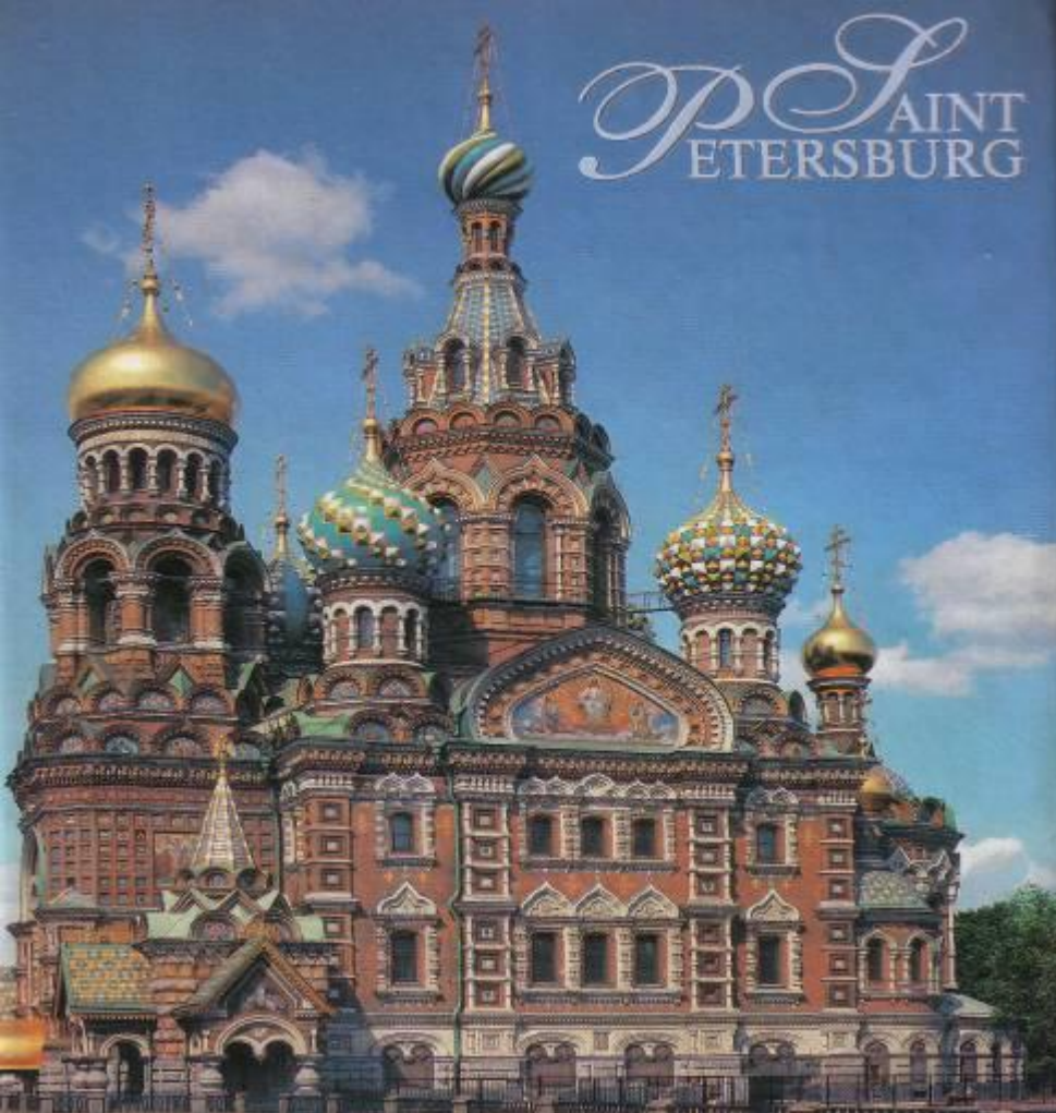
Храм Спаса на крови