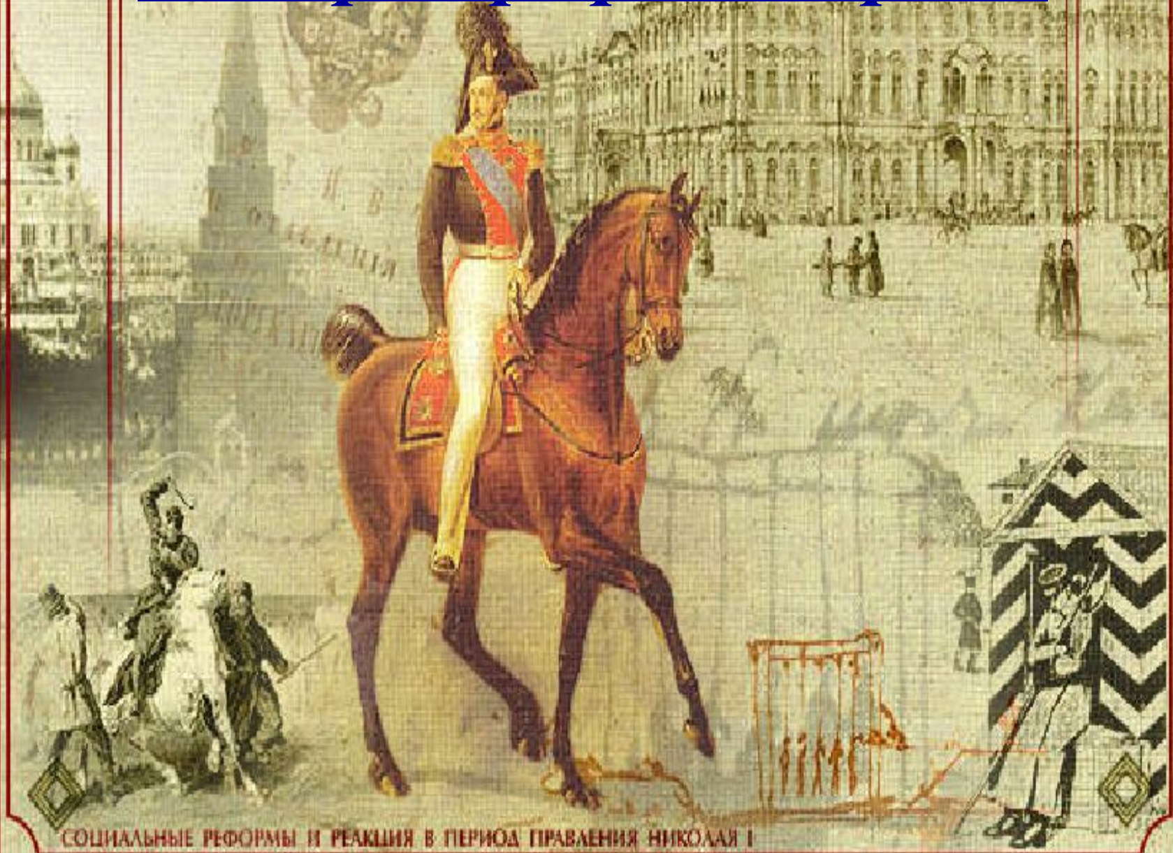
СОЦИАЛЬНЫЕ РЕФОРМЫ И РЕАКЦИЯ В ПЕРИОД ПРАВЛЕНИЯ НИКОЛАЯ I