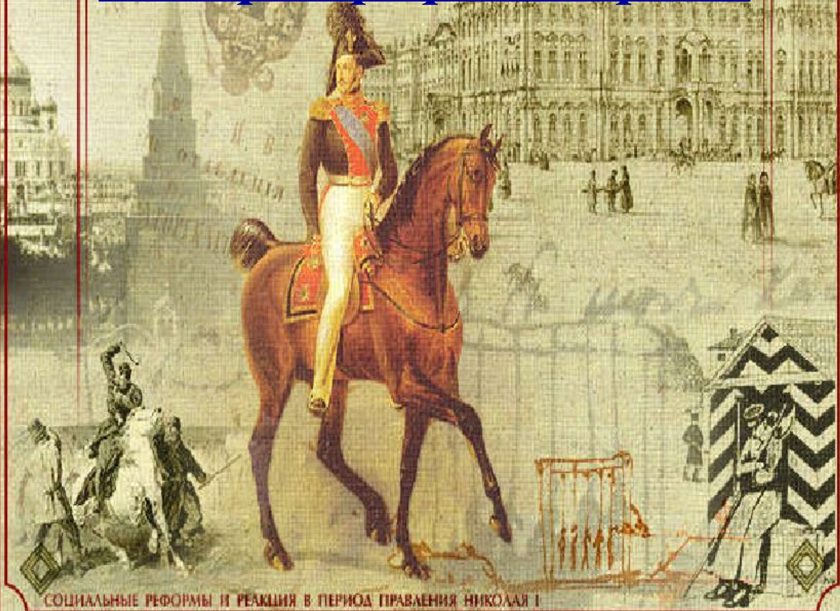
СОЦИАЛЬНЫЕ РЕФОРМЫ И РЕАКЦИЯ В ПЕРИОД ПРАВЛЕНИЯ НИКОЛАЯ I