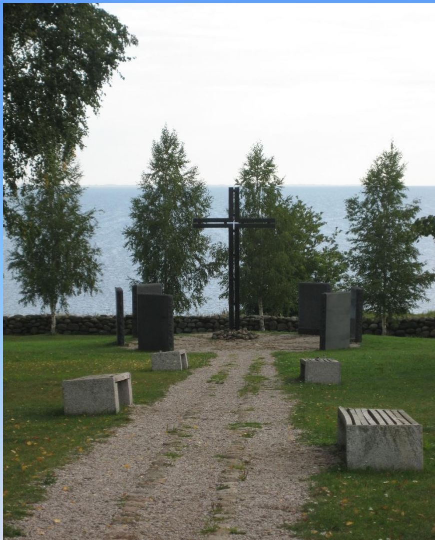
8. Католический крест на Немецком кладбище.