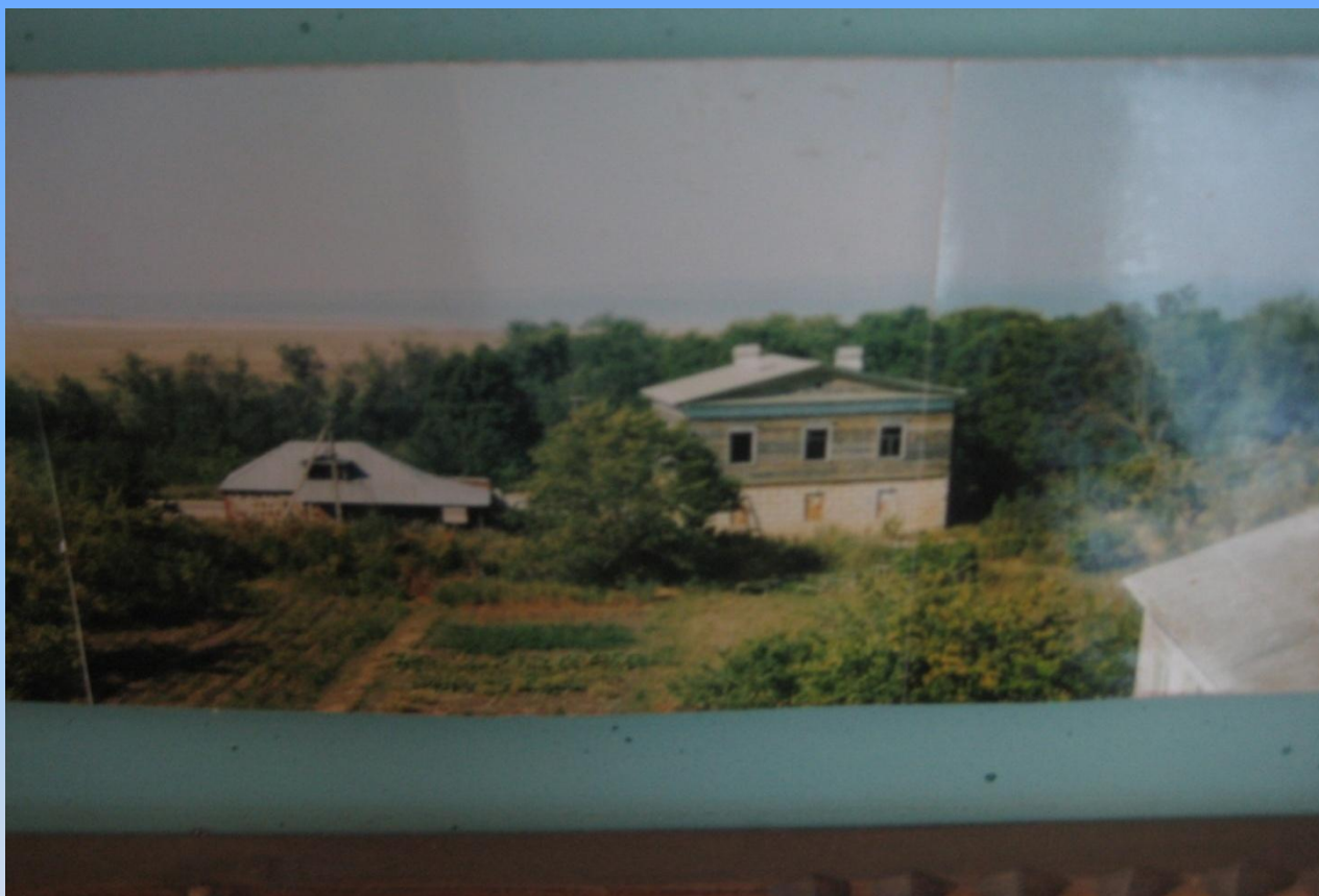
Фото автора 3. Вид на село и Путевой дворец