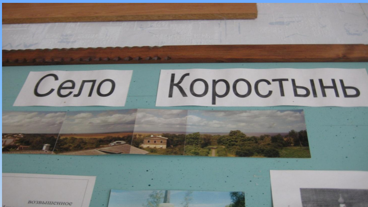
2. Село Коростынь. Выставка Коростынского краеведческого музея в школе №1