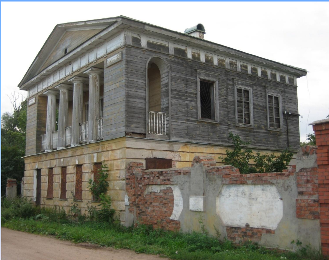
11. Путевой дворец.