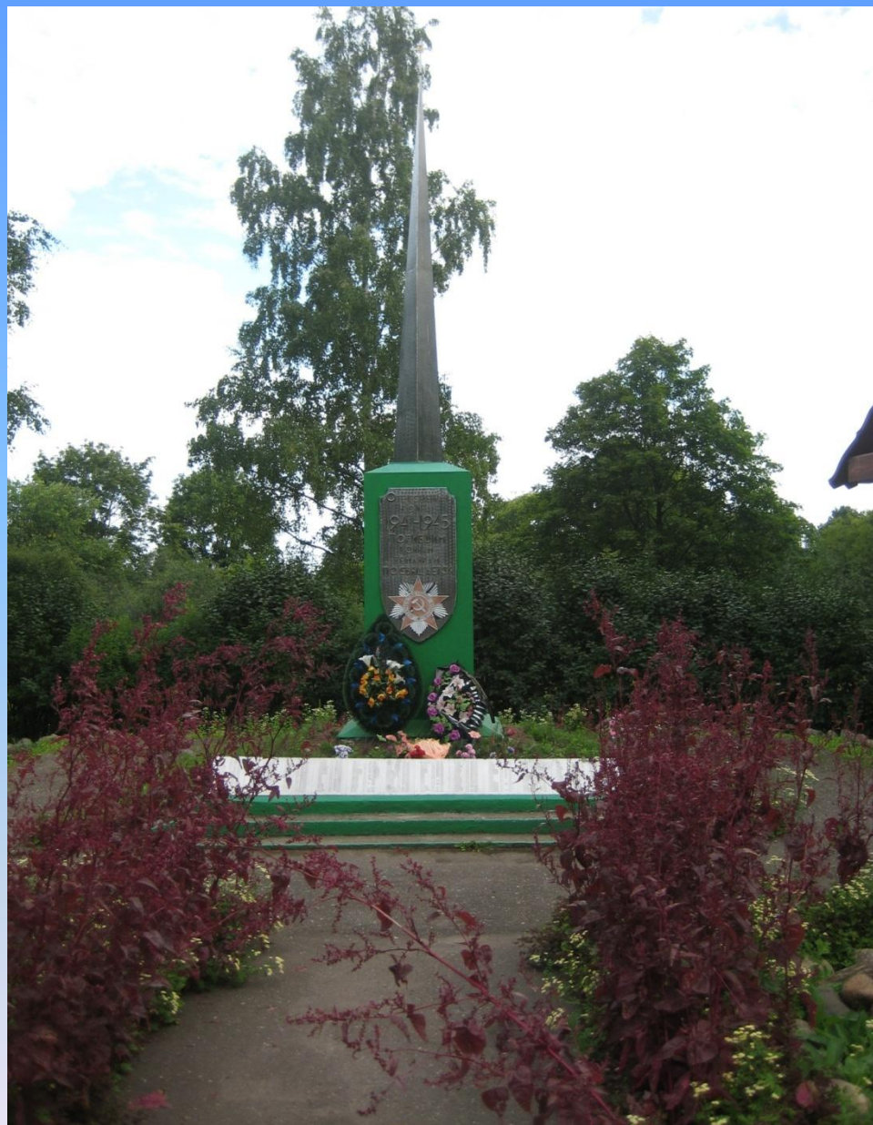
10. Обелиск воинам-землякам.