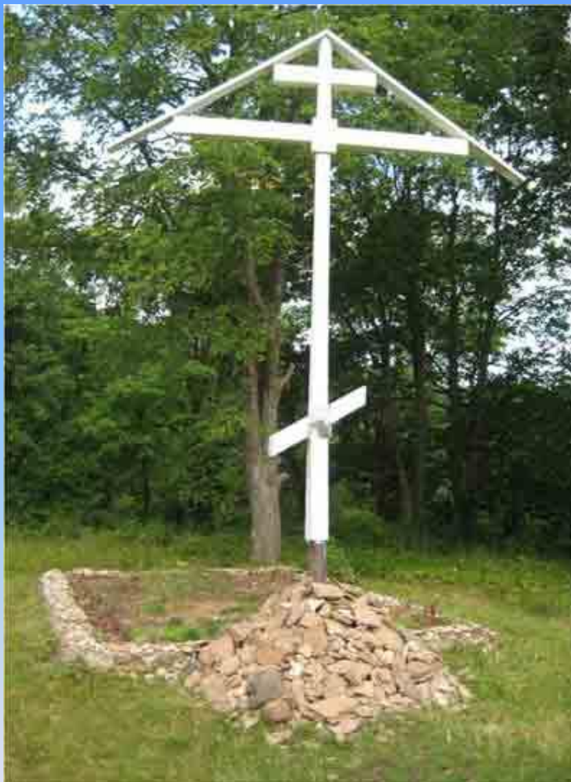
4. Памятный крест, установленный на предполагаемом месте подписания мирного договора.