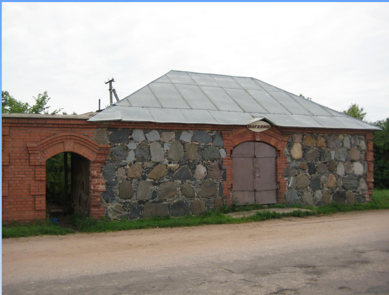
12. Амбар рядом с Путевым дворцом.