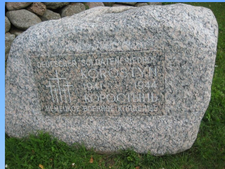
Фото автора 9. Памятный камень на немецком кладбище