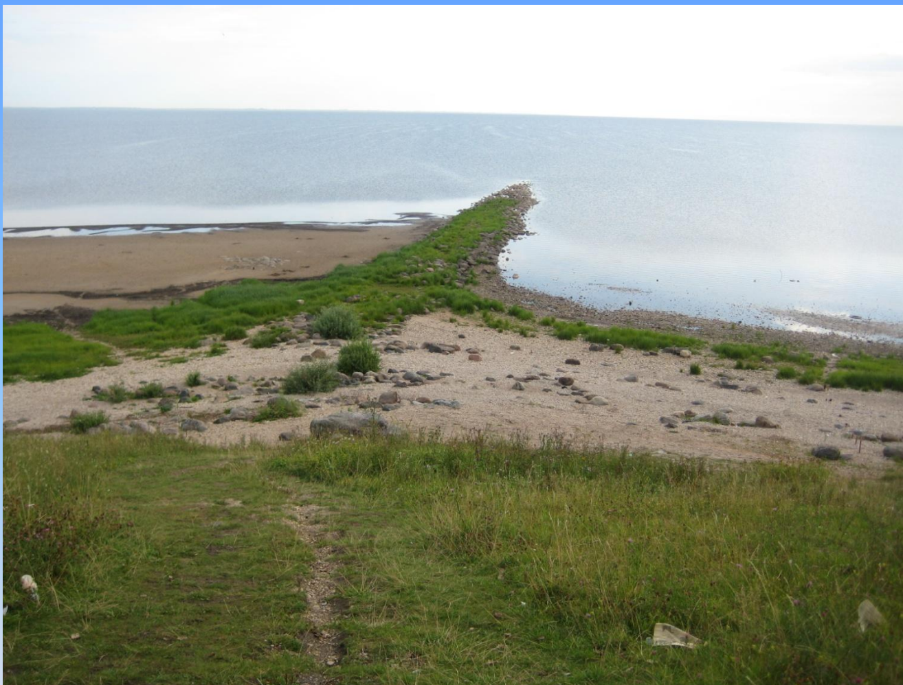
Фото автора 1. Берег озера Ильмень.