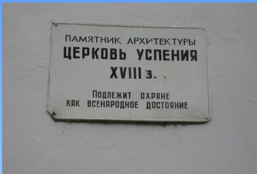
6. Надпись на Церкви Успения.