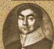
Петр Абрамович Ганнибал 1742 - 1825