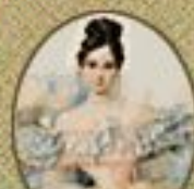
Наталья Николаевна Гончарова 1812 - 1863