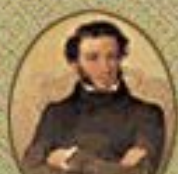
Александр Сергеевич Пушкин 1799 - 1837