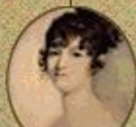
Надежда Осиповна Ганнибал 1775 - 1836