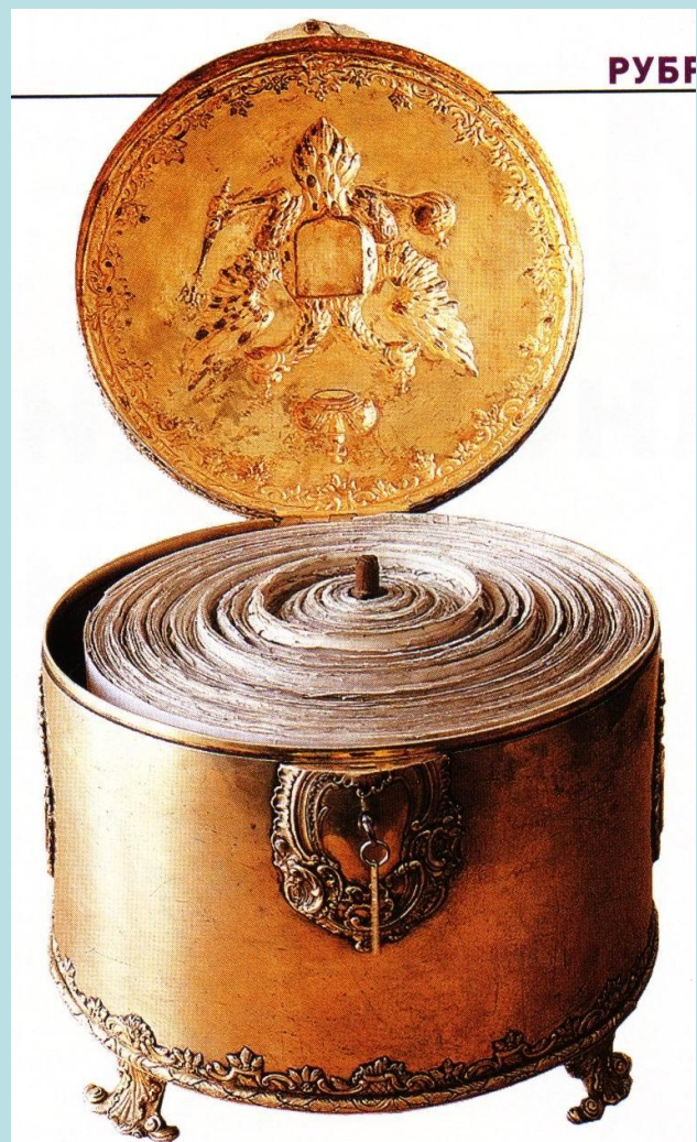
Соборное уложение в Ковчеге (текст — 1649 г., ковчег — 1767 г.)