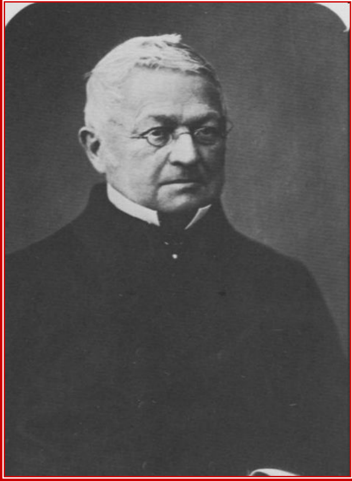
Адо́льф Тье́р – президент Третьей Французской республики (1871-1877)