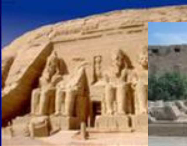
Храм Рамзеса, Абу – Симбел