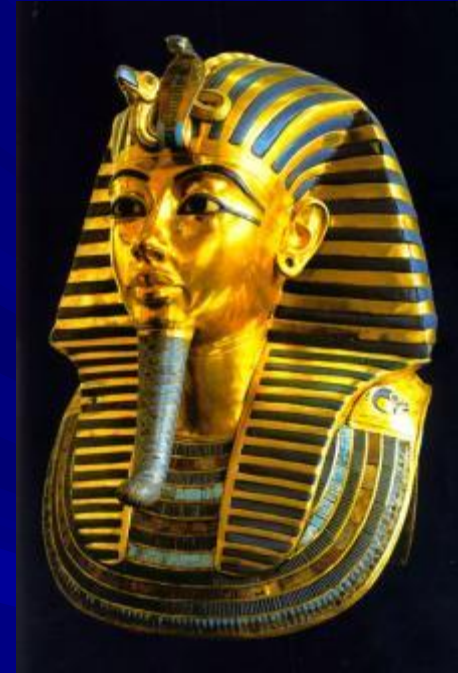
Золотой саркофаг Тутанхамона. Тутанхамон умер в возрасте 19 лет.