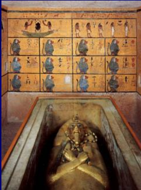
Погребальная камера с саркофагом Тутанхамона. Саркофаг – массивный гроб. Фараон – ц а р ь Египта