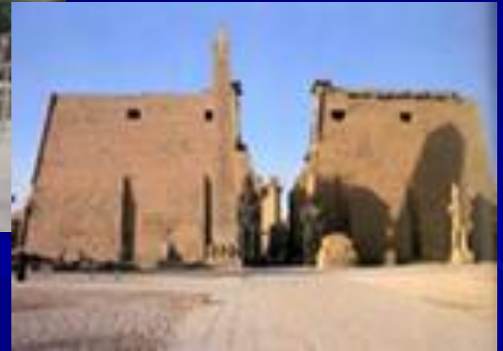
Храм бога Амона Ра в Луксоре