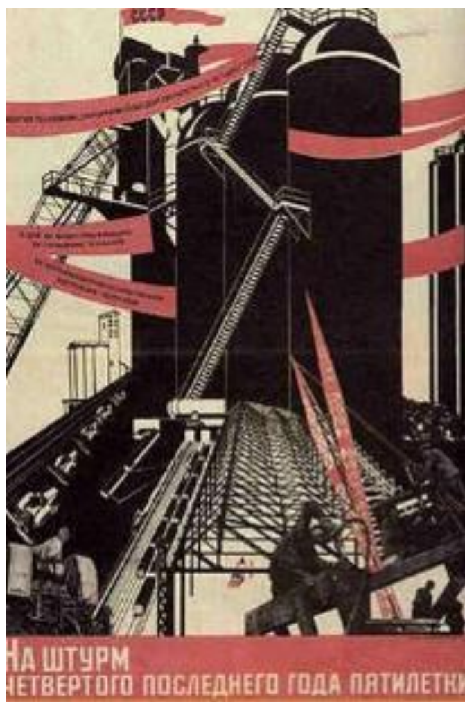
Н.Доглоруков. Пропагандистский плакат.

В 1932 г.объявив об успехе 1-й пятилетки,Сталин за метил,что теперь нет необходимости «подхлестывать страну» и 2-й пятилетний план предусматривал снижение темпов прироста промышленной продукции с 30 до 16 %,при этом рост легкой промышленности должен был быть выше , чем рост тяжелой.План предусматривал создание опорных промышленных баз на Урале,в Сибири, Средней Азии.