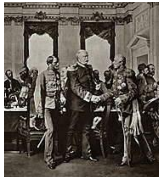
Берлинский конгресс лето 1878г.