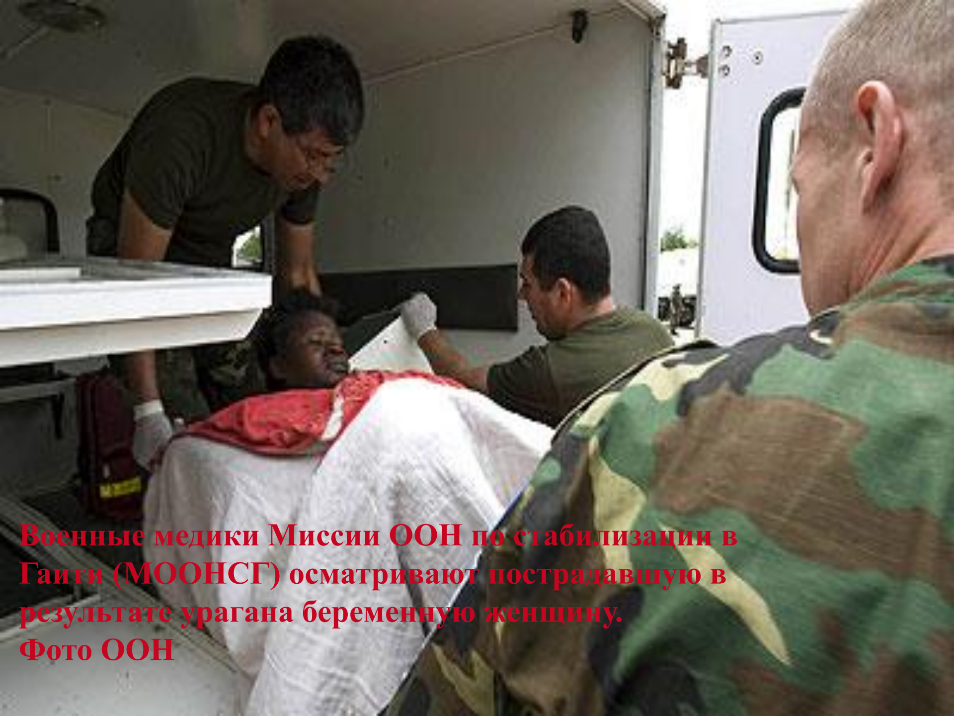
Военные медики Миссии ООН по стабилизации в Гаити (МООНСГ) осматривают пострадавшую в результате урагана беременную женщину.