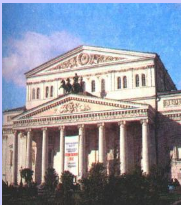
О.Бове Большой театр.

В Москве в стиле ампир выполнены работы О. Бове (реконструированная красная площадь, Большой театр,) Д. Жилярди (здание Московского университета).