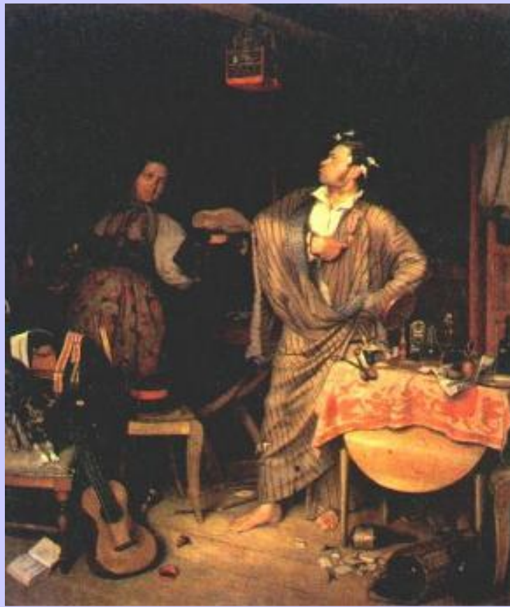
П.А.Федоров. Свежий кавалер.

Основоположником критического реализма в живописи стал П. Федоров, поднимавший в своих картинах социальные проблемы. В его «Свежем кавалере», чувствуется драматизм ситуации, критическое отношение автора к действительности и