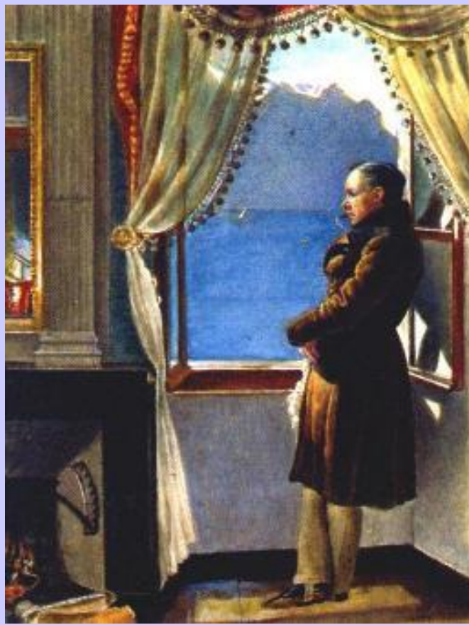
Рейтнер. Портрет В.А.Жуковского у окна.

Романтизм в русской культуре был связан с деятельностью В.Жуковского, К.Рылеева, А.Бестужева-Марлинского и др. В раннем творчестве А.Пушкина и М.Лермонтова, тоже проявились романтические начала. Но в отличие от В.Жуковского их герои занимают активную позицию в борьбе за идеалы свободы и романтизма.