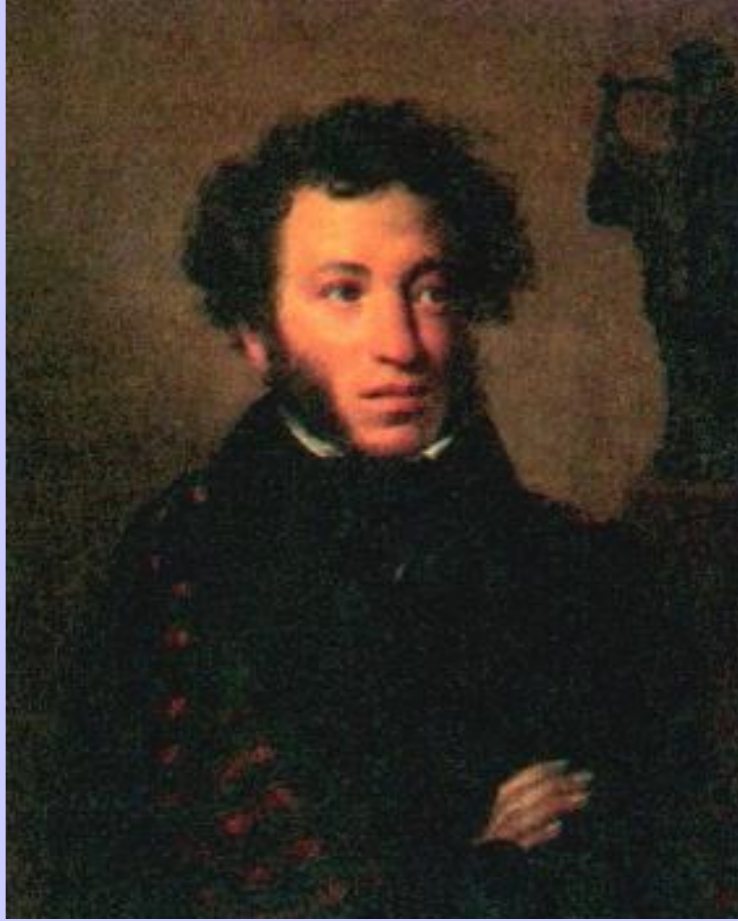
О.Кипренский Портрет А.С.Пушкина

В к. 20-х гг.наметился переход к новому направлению- реализму. Он проявился уже в трудах «позднего» Пушкина-«Борисе Годунове»,«Капитанской дочке», «Дубровский»,«Медный всадник», и в романе М.Лермонтова «Герой нашего времени».