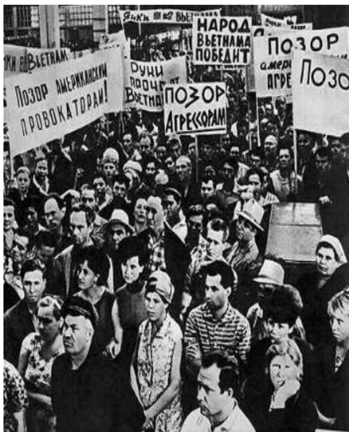
Митинг на АЗЛК против войны во Вьетнаме.

В сер.60-х гг.международная обстановка осложнилась. Война во Вьетнаме привела к обострению отношений СССР и США. Идеологические споры с Китаем привели к территориальным претензиям с его стороны и в 1969 г. произошел вооруженный конфликт из-за о.До манский. Критика сталинизма привела к конфликту с Китаем,Кореей и Албанией,а его «реабилитация» к спорам с компартиями Западной Европы.