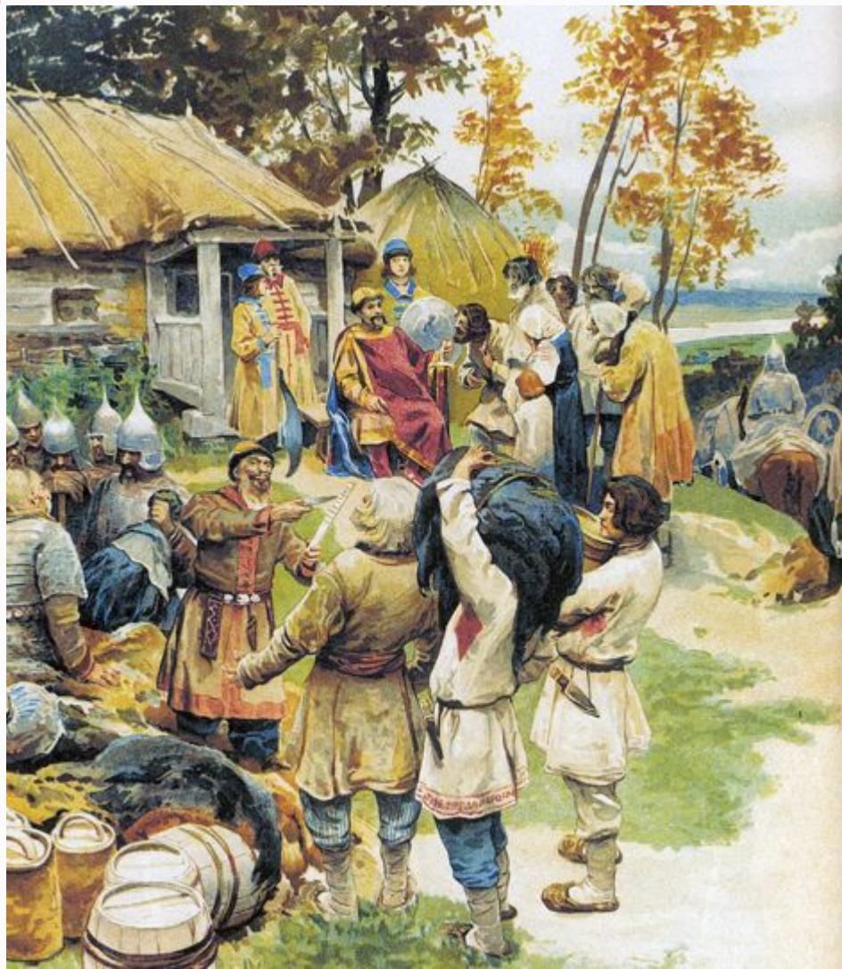
Лебедев К.В. Сбор дани. Полюдьё