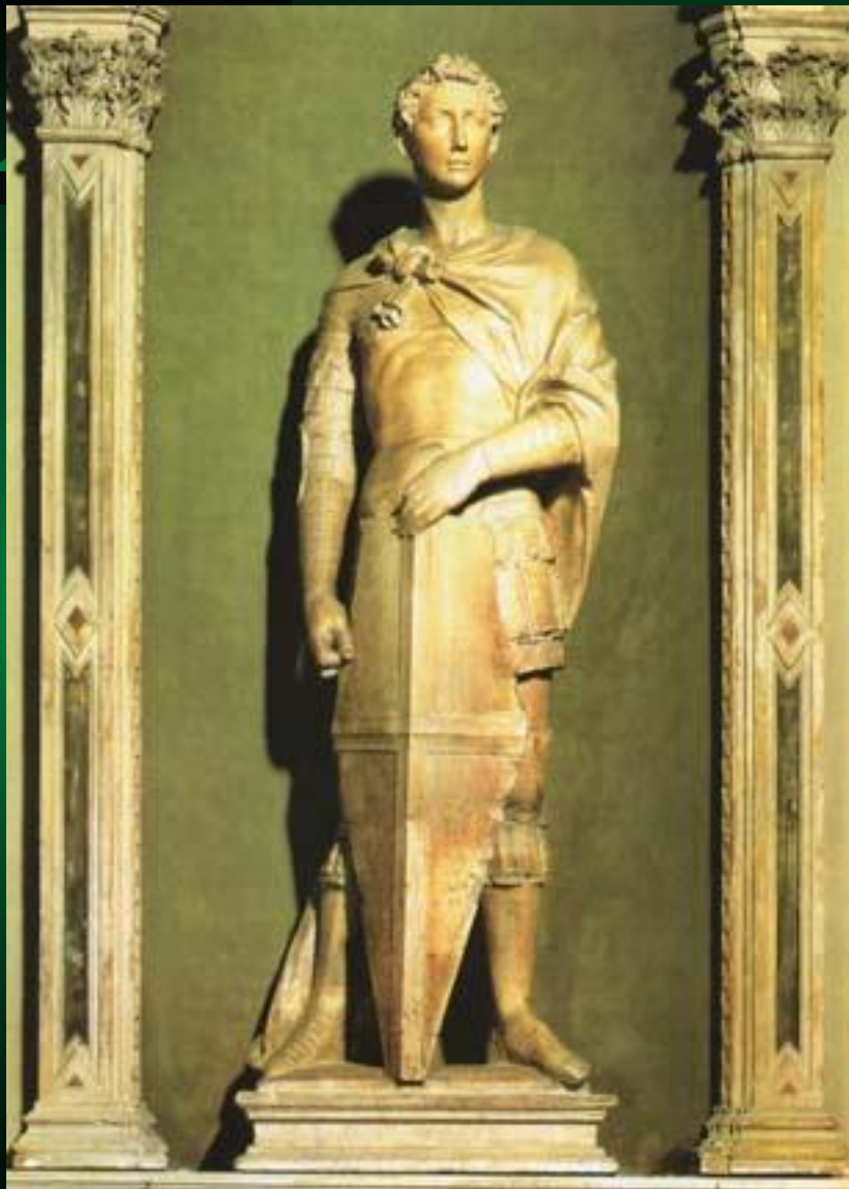
Скульптура св.Георгия (Данателло)