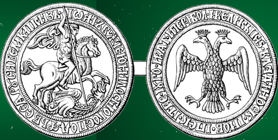
Монеты московских князей

Святой Георгий – идеальный образ воина – защитника Родины.