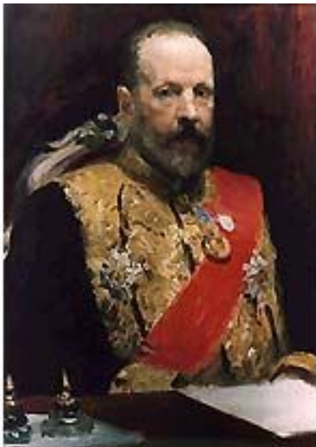
Витте Сергей Юльевич Министр финансов с 1892