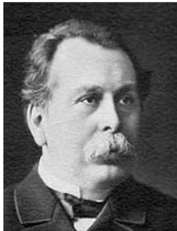
Плеве Вячеслав Константинович Министр внутренних дел с 1902 года