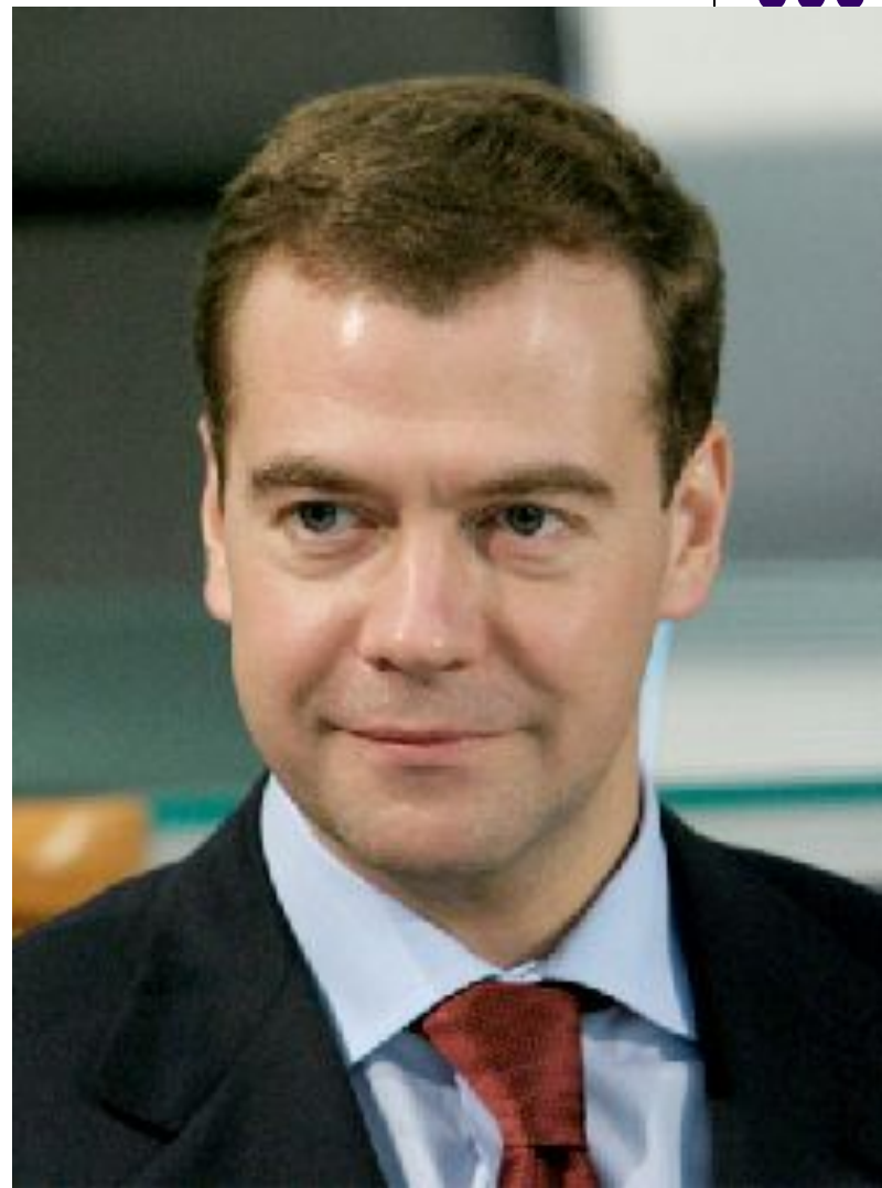
Президент России Д.А. Медведев.

В целях борьбы с коррупцией в России в июле 2008 г. Президентом РФ был утверждён Национальный план противодействия коррупции.