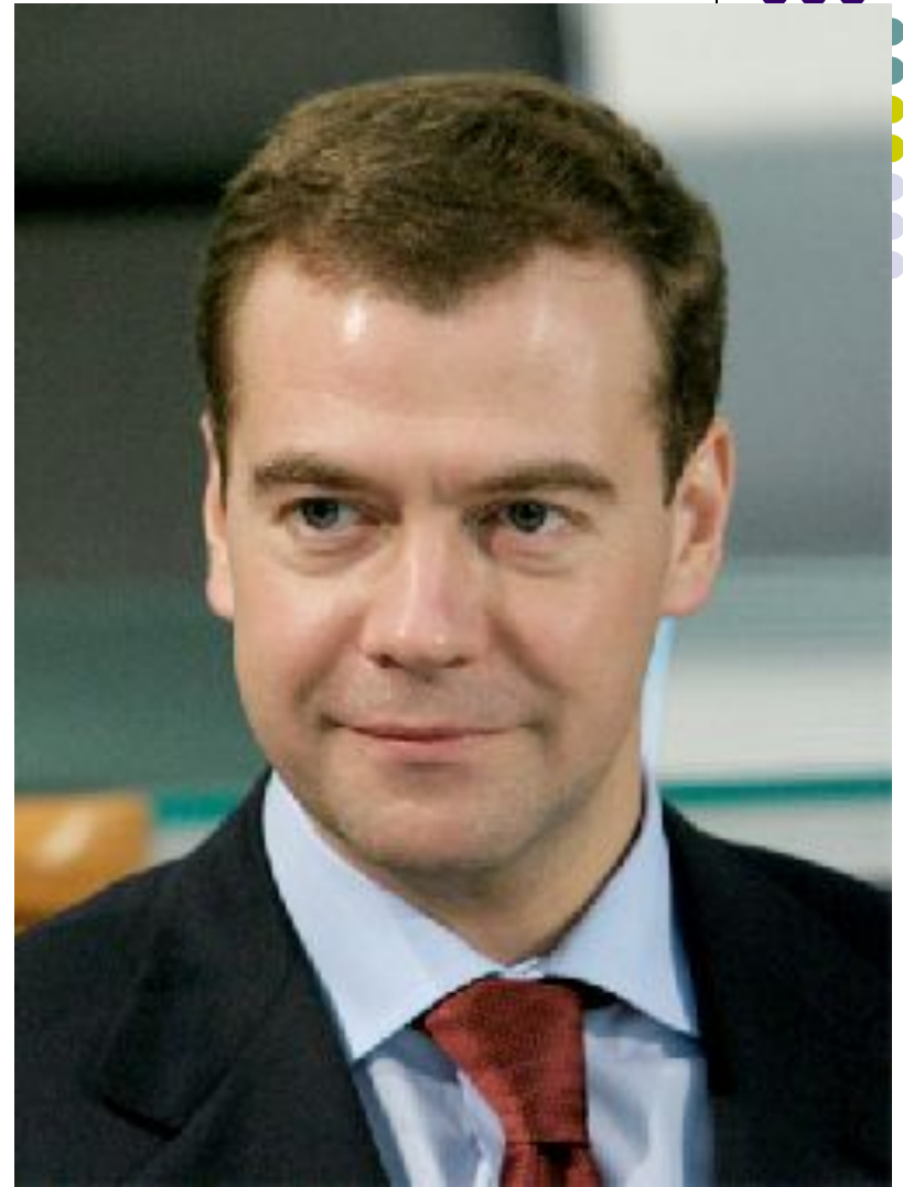
Президент России Д.А. Медведев.

В целях борьбы с коррупцией в России в июле 2008 г. Президентом РФ был утверждён Национальный план противодействия коррупции.