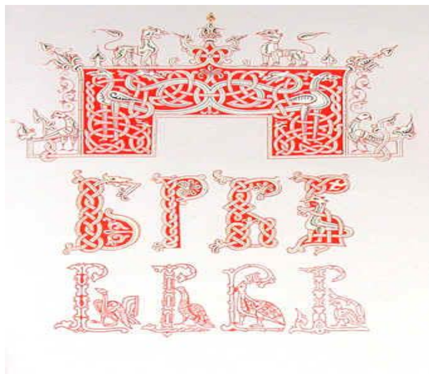
Первые два ряда: заставка и буквицы из Евангелия XII в., нижний ряд - буквицы из Евангелия 1120 г.