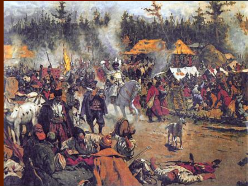
С.В. Иванов. "В смутное время"

"С осени 1606г. в государстве открылась кровавая смута, в которой приняли участия все сословиями московского общества, восстав одно на другое".