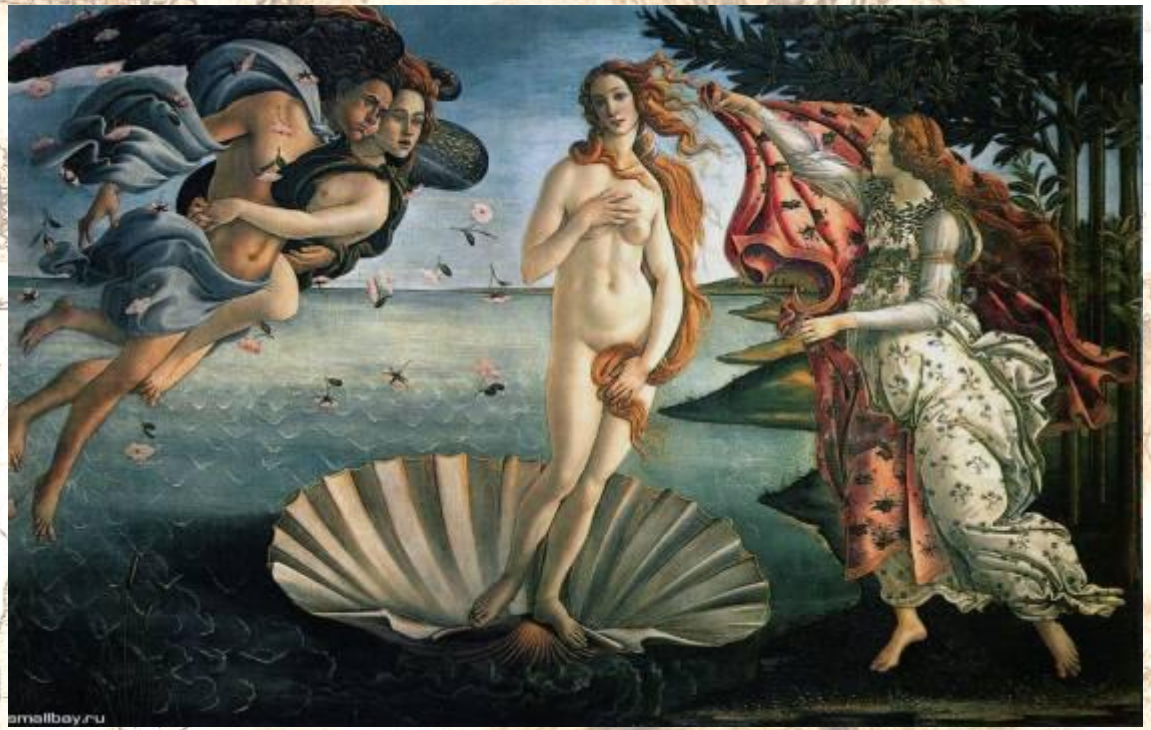
Сандро Боттичелли Рождение Венеры