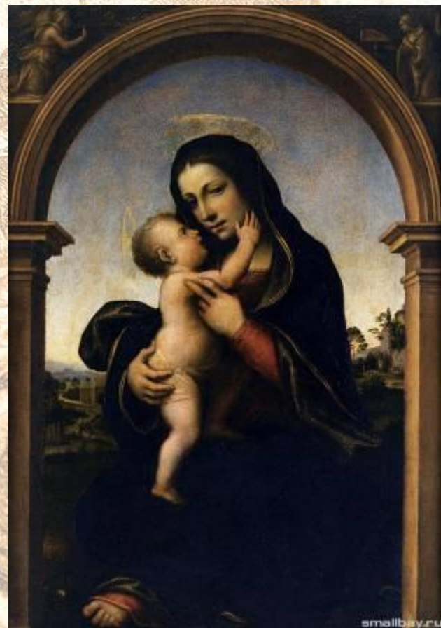
Мадонна с младенцем Альбертинелли Мариотто