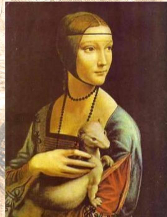
Девушка с горностаем