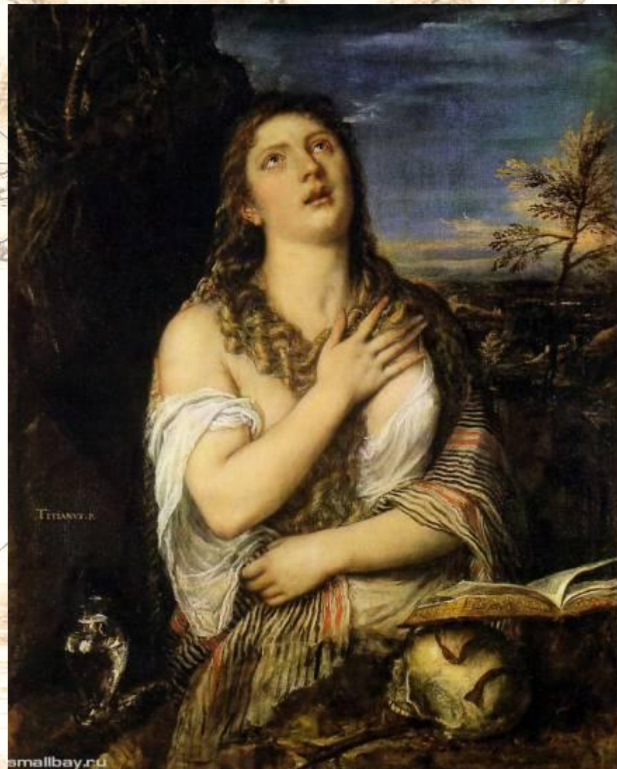
Тициан Кающаяся Мария Магдалина

Творчество Микеланджело, Тициана обретает драматическую напряженность, трагизм.