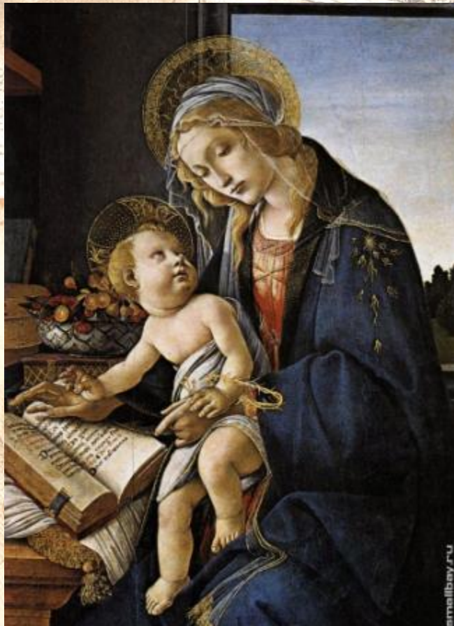
Сандро Боттичелли Мадонна с книгой