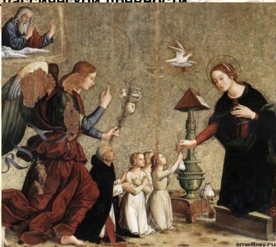
Благовещенье Антониаццо Романо

Период Раннего Возрождения охватывает собой в Италии время с 1420 охватывает собой в Италии время с 1420 по 1500 года. В течение этих восьмидесяти лет искусство ещё не вполне отрешается от преданий недавнего прошлого, но пробует примешивать к ним элементы, заимствованные из классической древности.