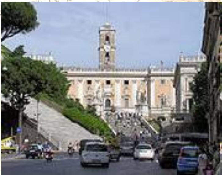
Капитолийский дворец и музеи (арх. Микеланджело Буонаротти).