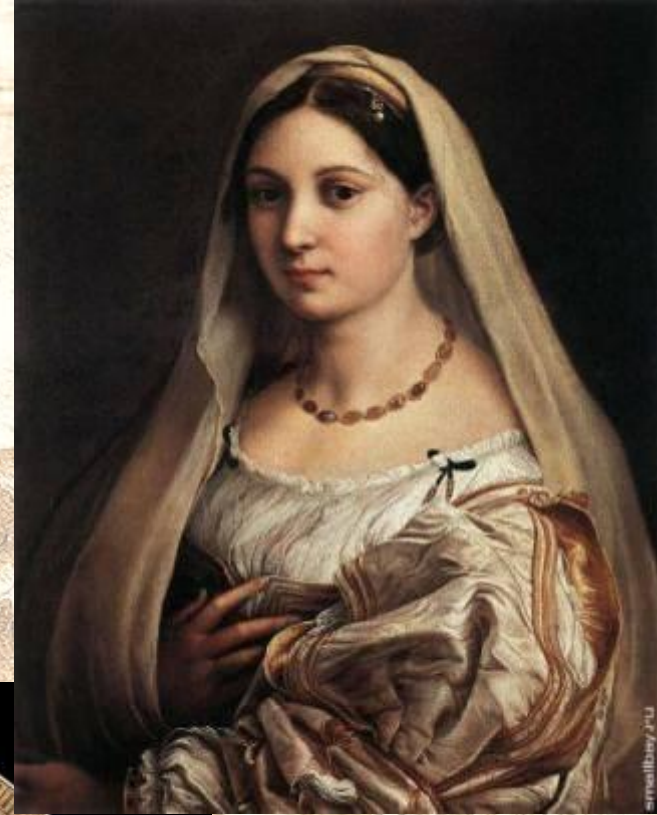
Дама в покрывале