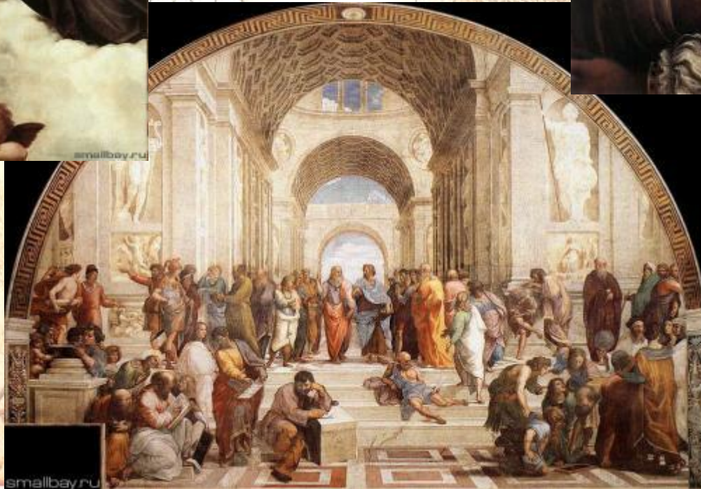
Фреска Афинская школа