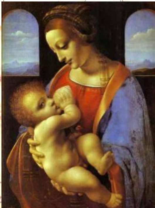
Мадонна с щегленком