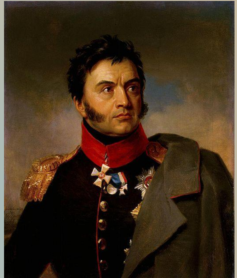
Николай Николаевич Раевский (1771—1829) русский полководец, генерал от кавалерии.

В 14 часов французы главный удар перенесли на батарею Раевского, которая после падения Багратионовских флешей стала открыта уже не только для фронтального, но и для флангового удара. Наполеон сосредоточил против нее огонь около 300 орудий). После третьей отчаянной атаки им удалось к 17 часам ворваться на высоту.