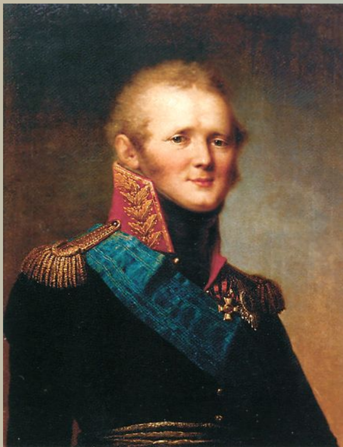
Александр I Павлович Благословенный— Государь император и самодержец Всероссийский

О результатах Бородинского сражения Кутузов доносил Александр I :