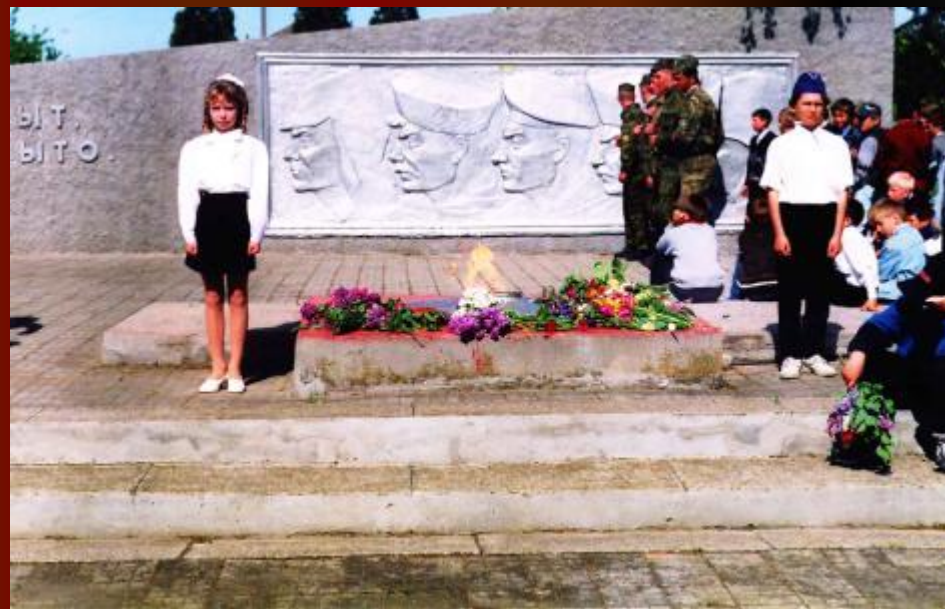
Вахта памяти у Вечного огня. ст.Должанская.

Пусть всегда на братских могилах будут живые цветы. Вечная память павшим в боях при защите Отечества – нашим сыновьям, отцам, дедам, братьям, сестрам, родным, друзьям. Пусть всегда на планете будет мир и спокойствие!