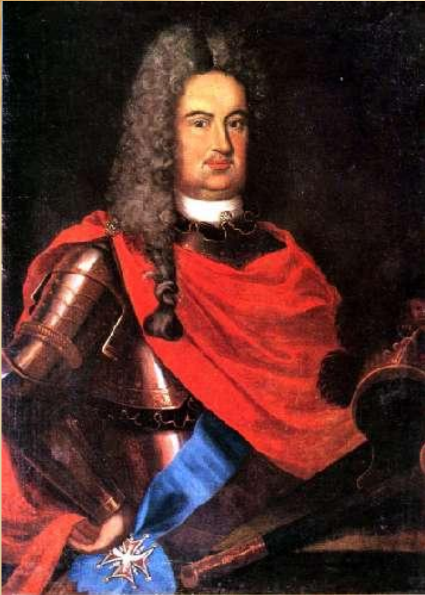
Борис Петрович Шереметев