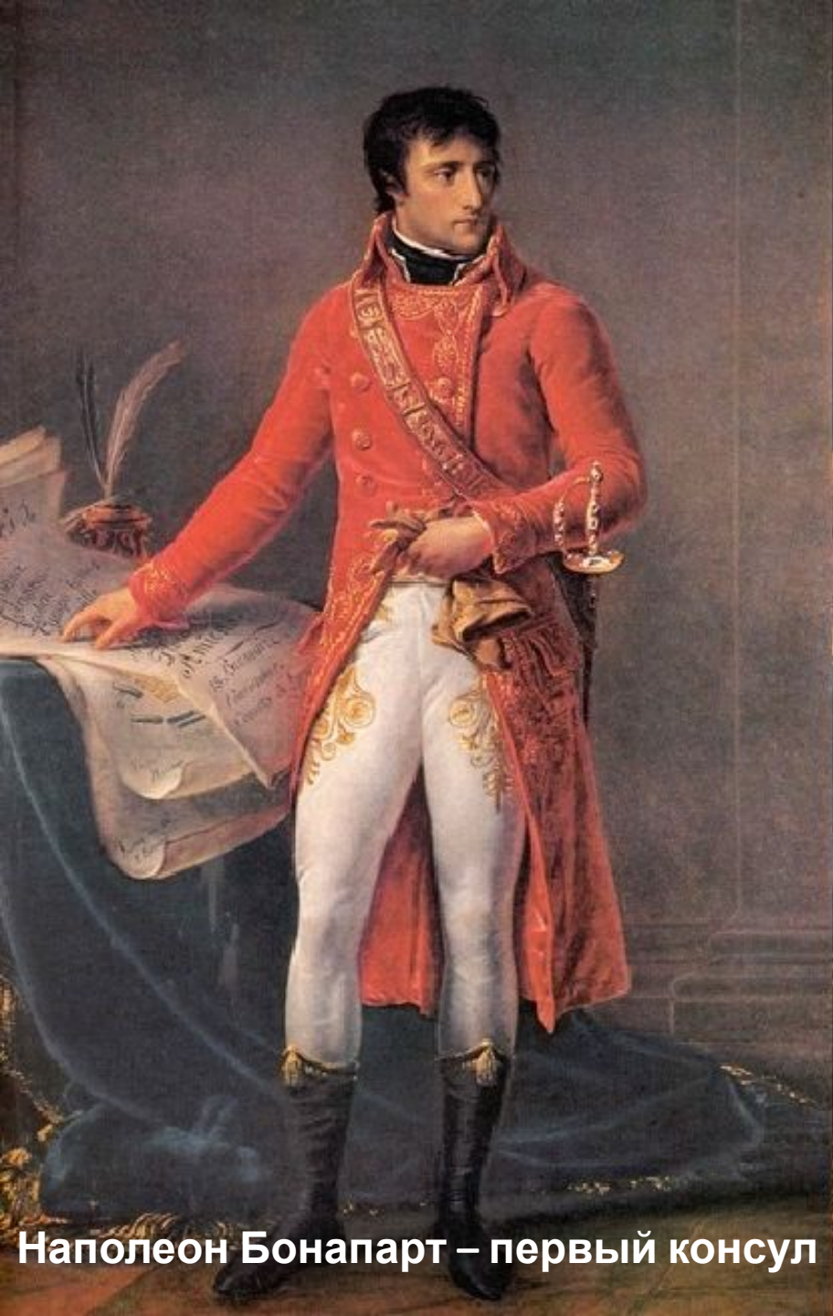
Наполеон Бонапарт – первый консул

9—10 ноября (18—19 брюмера VIII года Республики ) 1799 г. - государственный переворот - окончание Великой французской буржуазной революции.