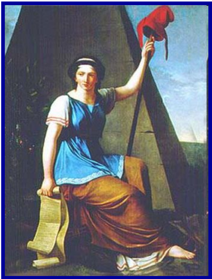
Великая французская революция. Конституция Франции