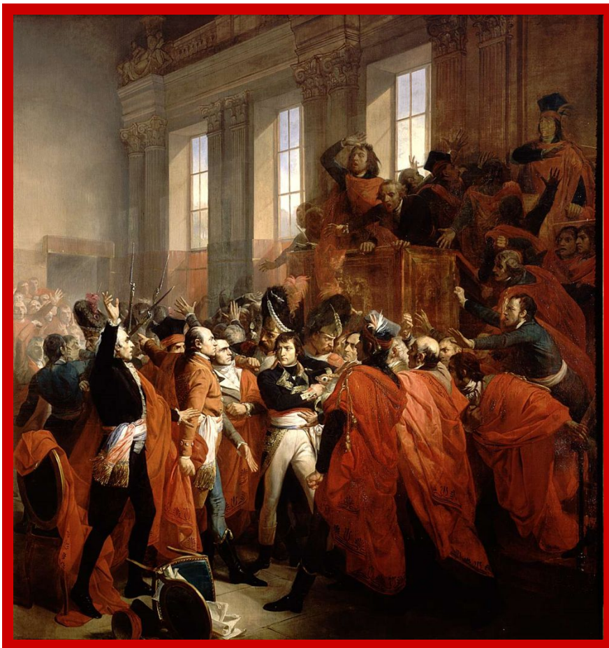
Государственный переворот 18—19 брюмера VIII года Республики

Однако конституция 1795 г. не смогла учредить во Франции устойчивой государственной власти, Директория постоянно лавировала между своими противниками — якобинцами и роялистами, попеременно привлекая на свою сторону то одних, то других. В конечном счете она окончательно себя скомпрометировала.