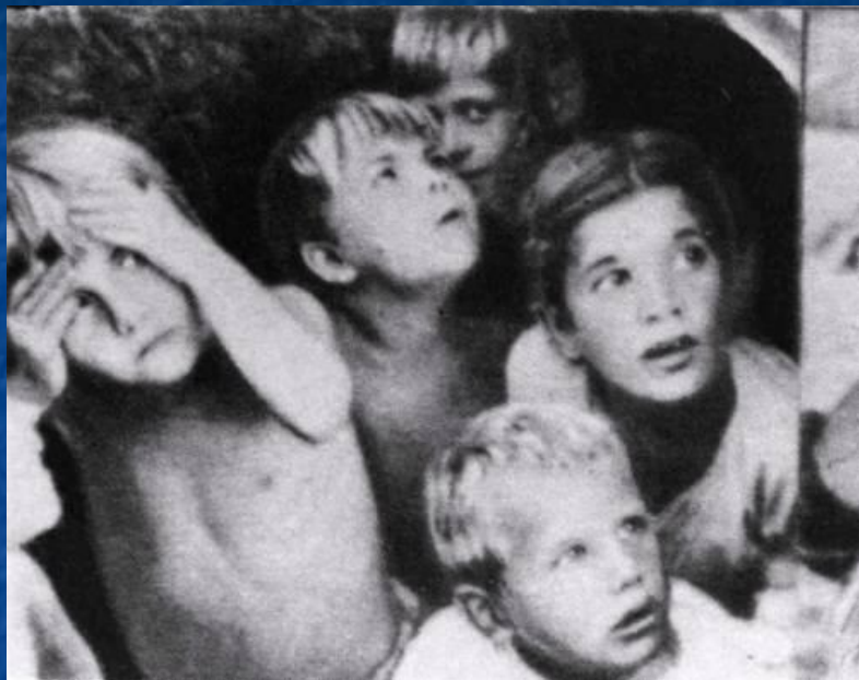
Испуг детей во время бомбежки. 1941 год.