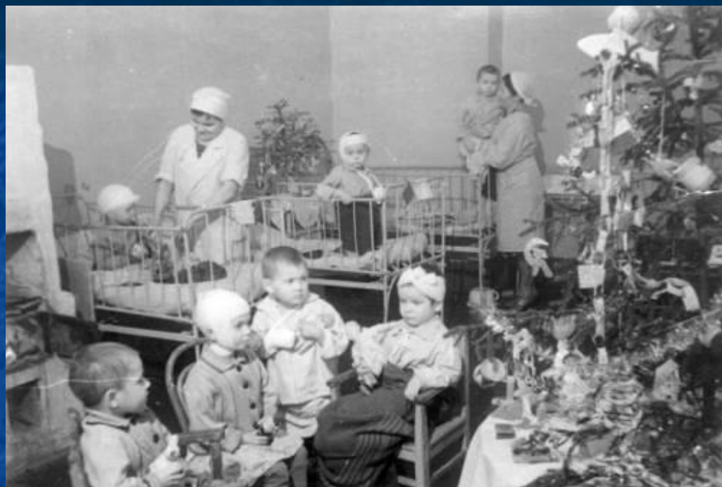
Новогодняя елка в хирургическом отделении Городской детской больницы имени К.А.Раухфуса. Декабрь 1942г.

Много страшного осталось в их памяти. Как тосковали, когда наступило первое сентября сорок первого года и не надо было идти в школу. Как, только встав на ящики, дотягивались до станков и в десять – двенадцать лет работали по двенадцать часов в сутки. Как получали на погибших отцов похоронки. Как, увидев после войны первый батон, не знали, можно ли его есть, потому что“... я забыл за четыре года, что это такое – белый батон”