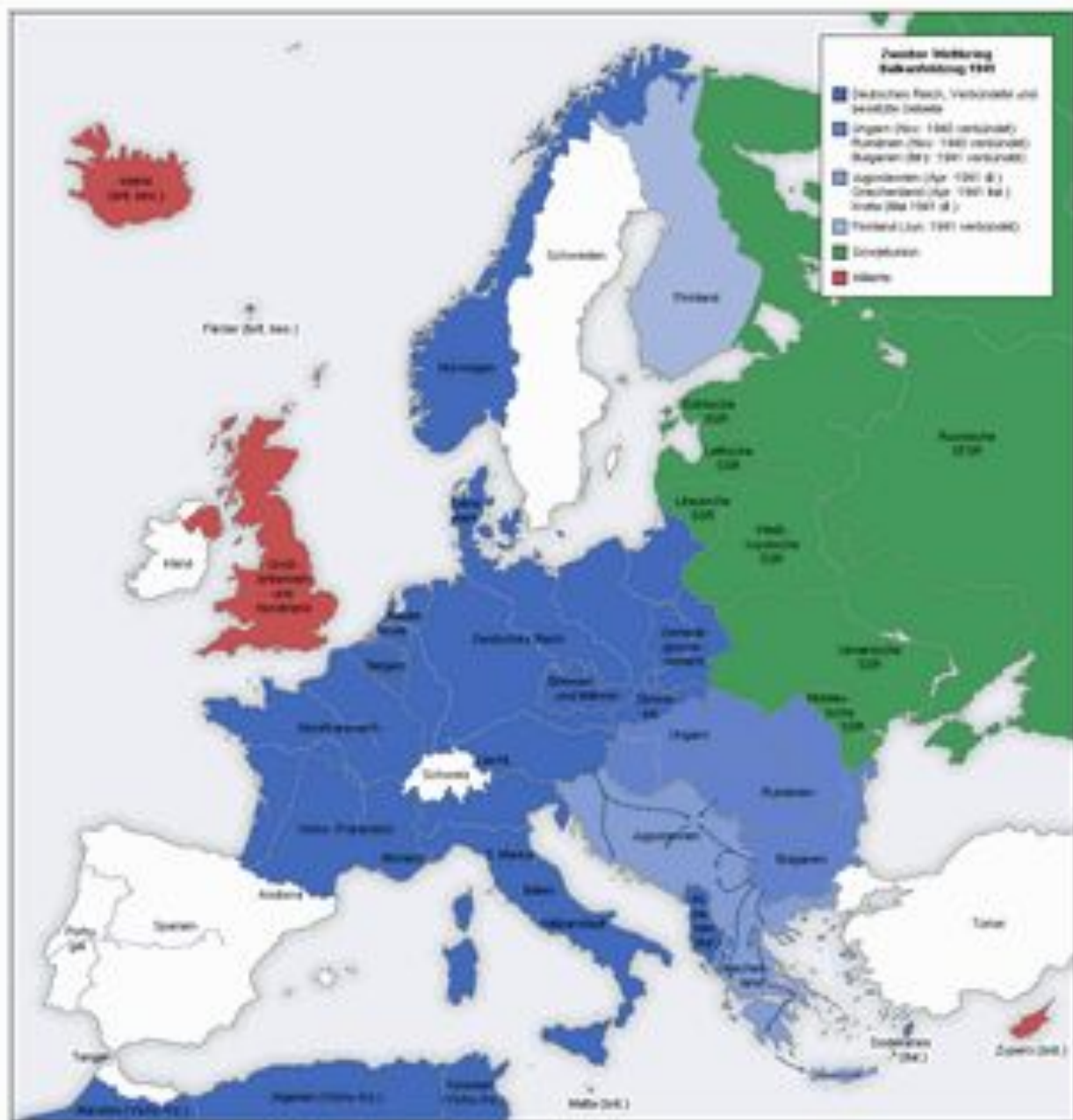
Карта Европы к июню 1941 года

Синий цвет - Германия, союзники, протектораты. Розовый - Англия. Зелёный - СССР