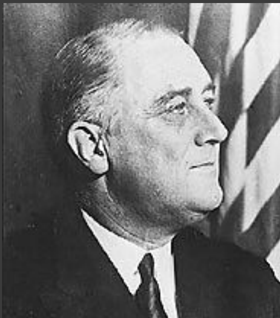
Президент США Франклин Рузвельт