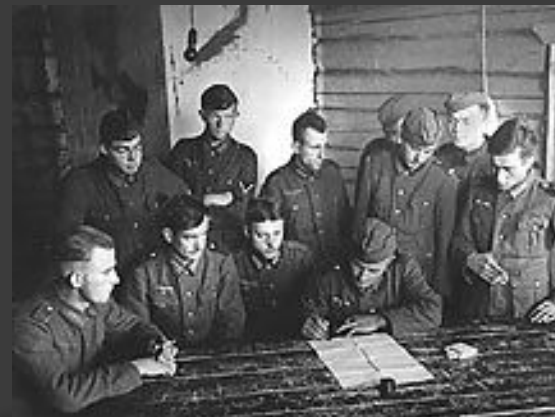
Немецкие солдаты на Западном фронте. Осень 1939 года.

Англо-французские и сосредоточенные против них германские войска бездействовали. Правительства Великобритании и Франции рассчитывали на примирение с Германией, а немецкая армия готовилась к наступлению против стран Зап. Европы.