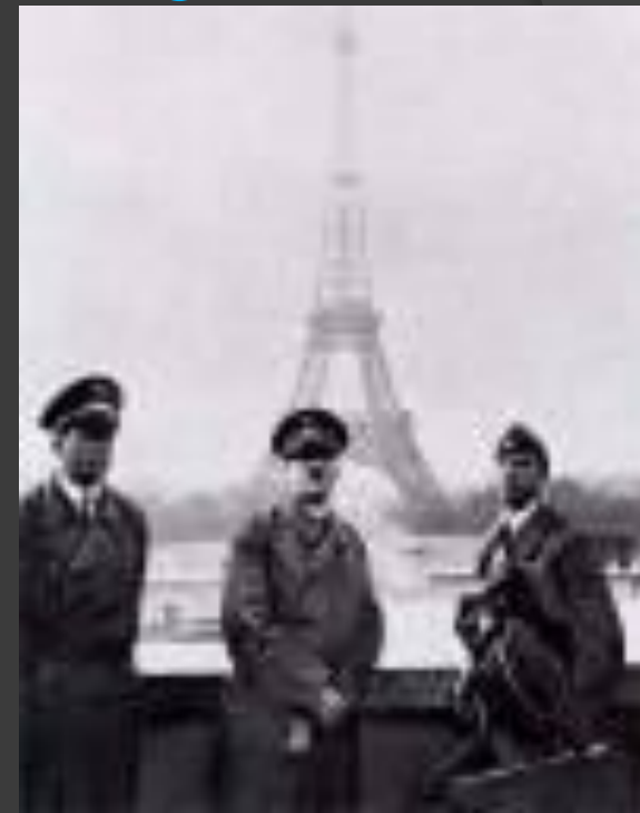
А.Гитлер с соратниками в Париже 1940 год