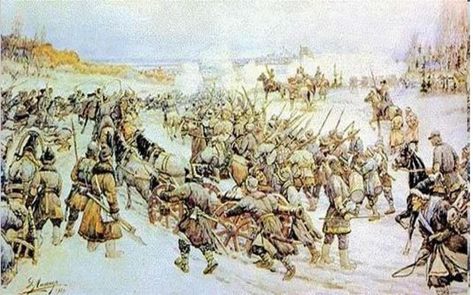
Войско Болотниково под Москвой. Художник Э. Лисснер