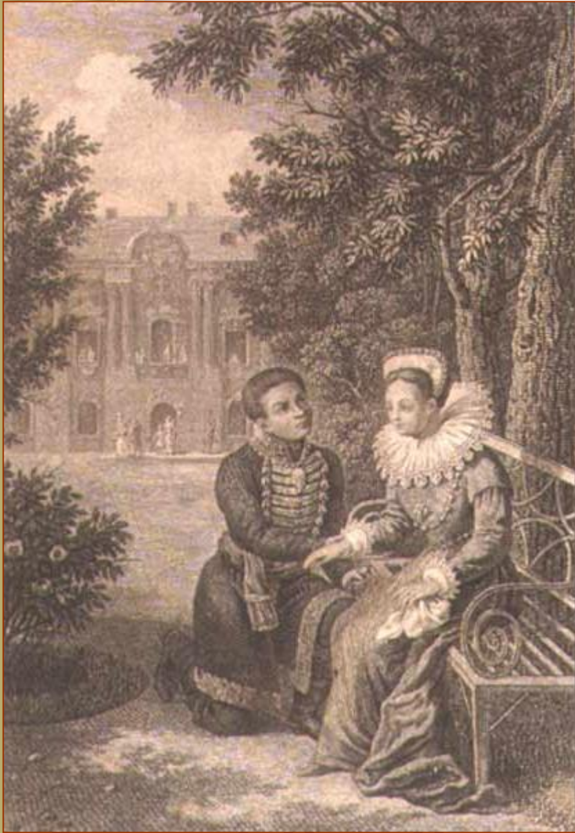
Лжедмитрий I и Марина Мнишек

Новый царь раздал должности полякам, остальные обещания не выполнил. В мае состоялась его свадьба с Мариной Мнишек (дочерью польского воеводы).