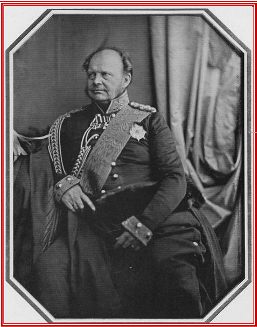
Фридрих Вильгельм IV - король Пруссии (1840-1861)

Король Фридрих Вильгельм IV отверг конституцию. Затем конституцию отвергли руководители многих германских государств.