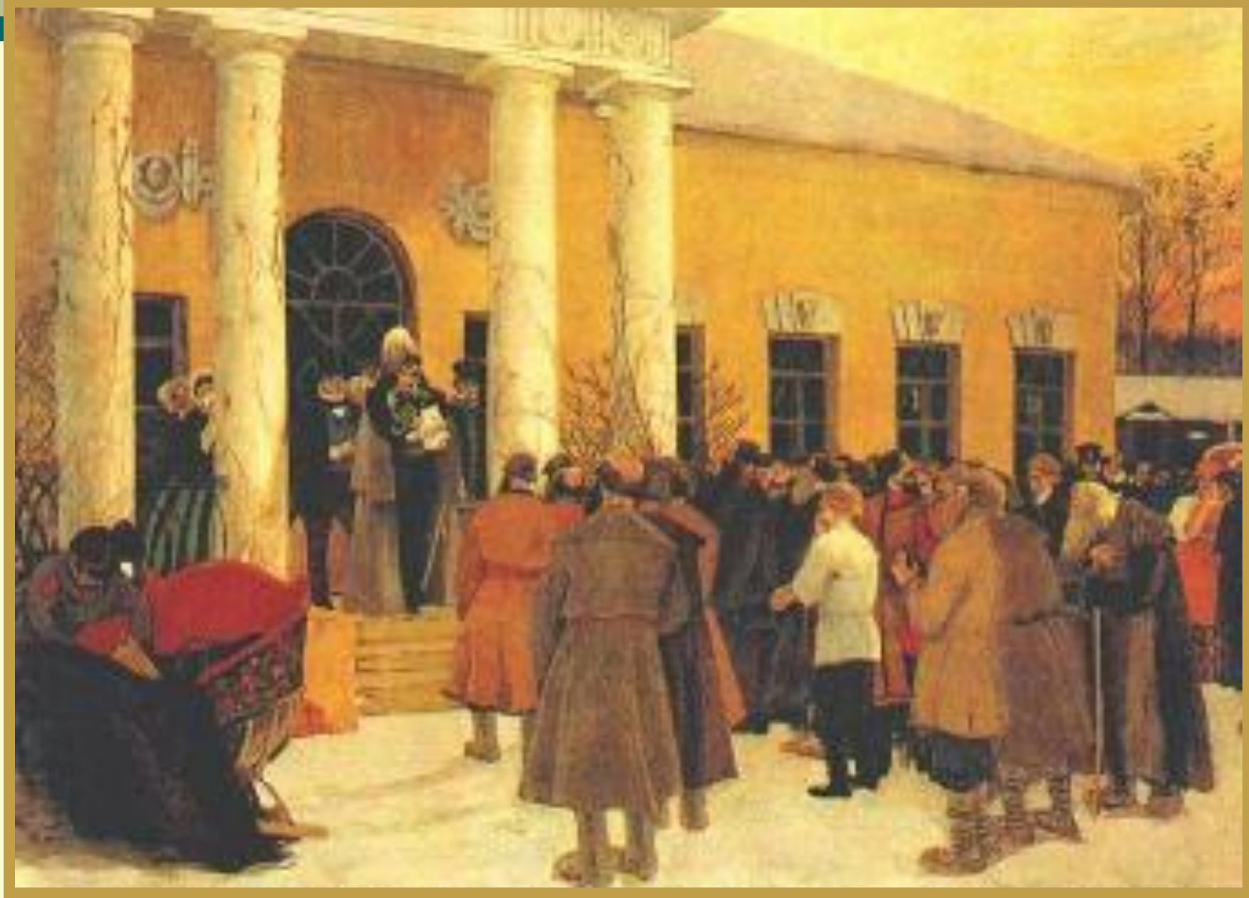
Б. Кустодиев «Освобождение крестьян»