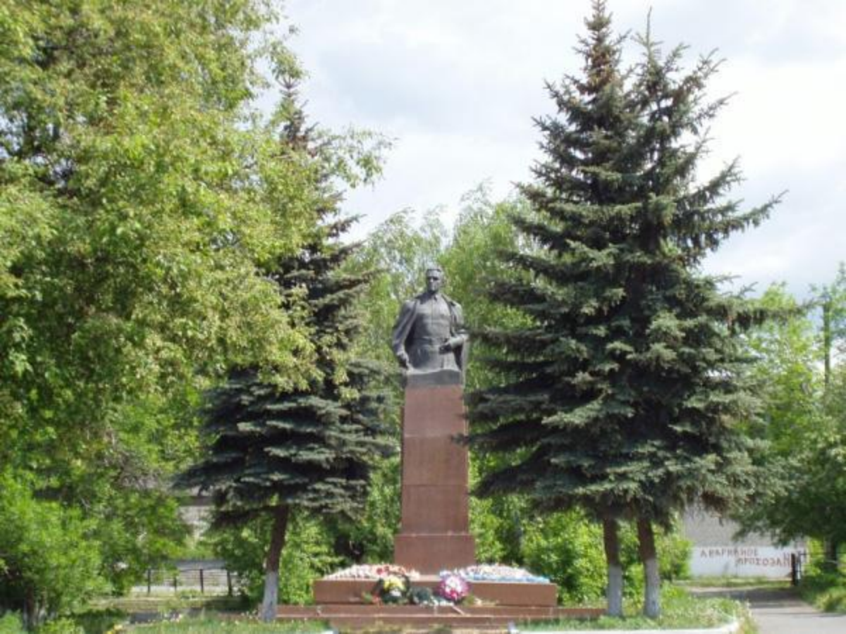
Памятник в г.Талица