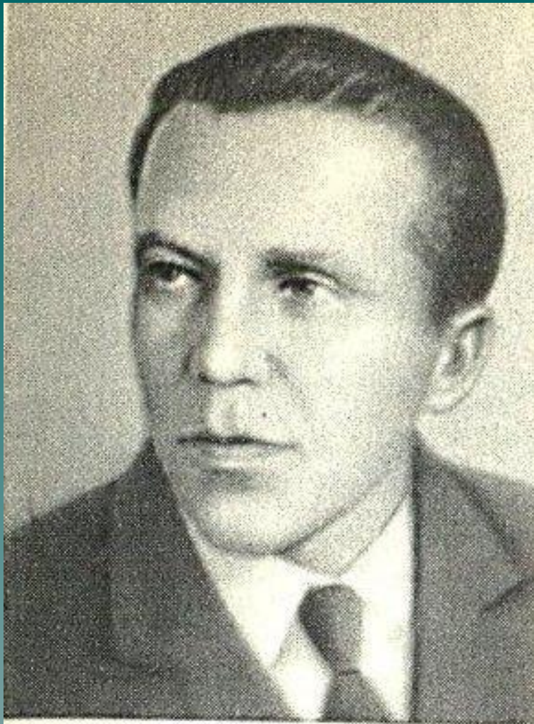
Герой Советского Союза Николай Иванович Кузнецов.

"Я люблю жизнь и хочу жить, я ещё очень молод. Но если для Родины, которую я люблю, как свою родную мать, нужно пожертвовать жизнью, я сделаю это. Пусть я умру, но в памяти народной патриоты бессмертны".