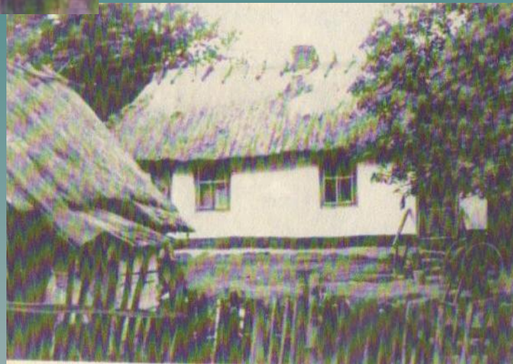
Дом в с.Боратин, где погиб Н.И.Кузнецов