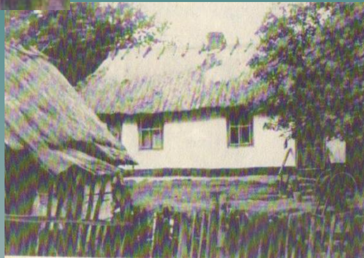
Дом в с.Боратин, где погиб Н.И.Кузнецов