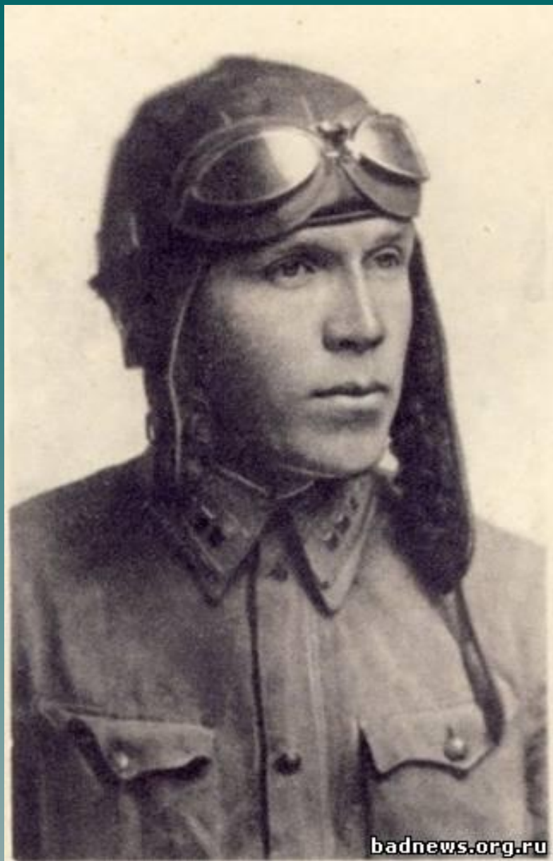
На аэродроме во время тренировочных прыжков. 1942 г. Москва.

Весной 1938 года Н.И.Кузнецов переезжает в Москву. Здесь он работает в КГБ и заочно учится в институте иностранных языков. Он много читает, переводит тексты с немецкого языка, изучает историю и культуру Германии.