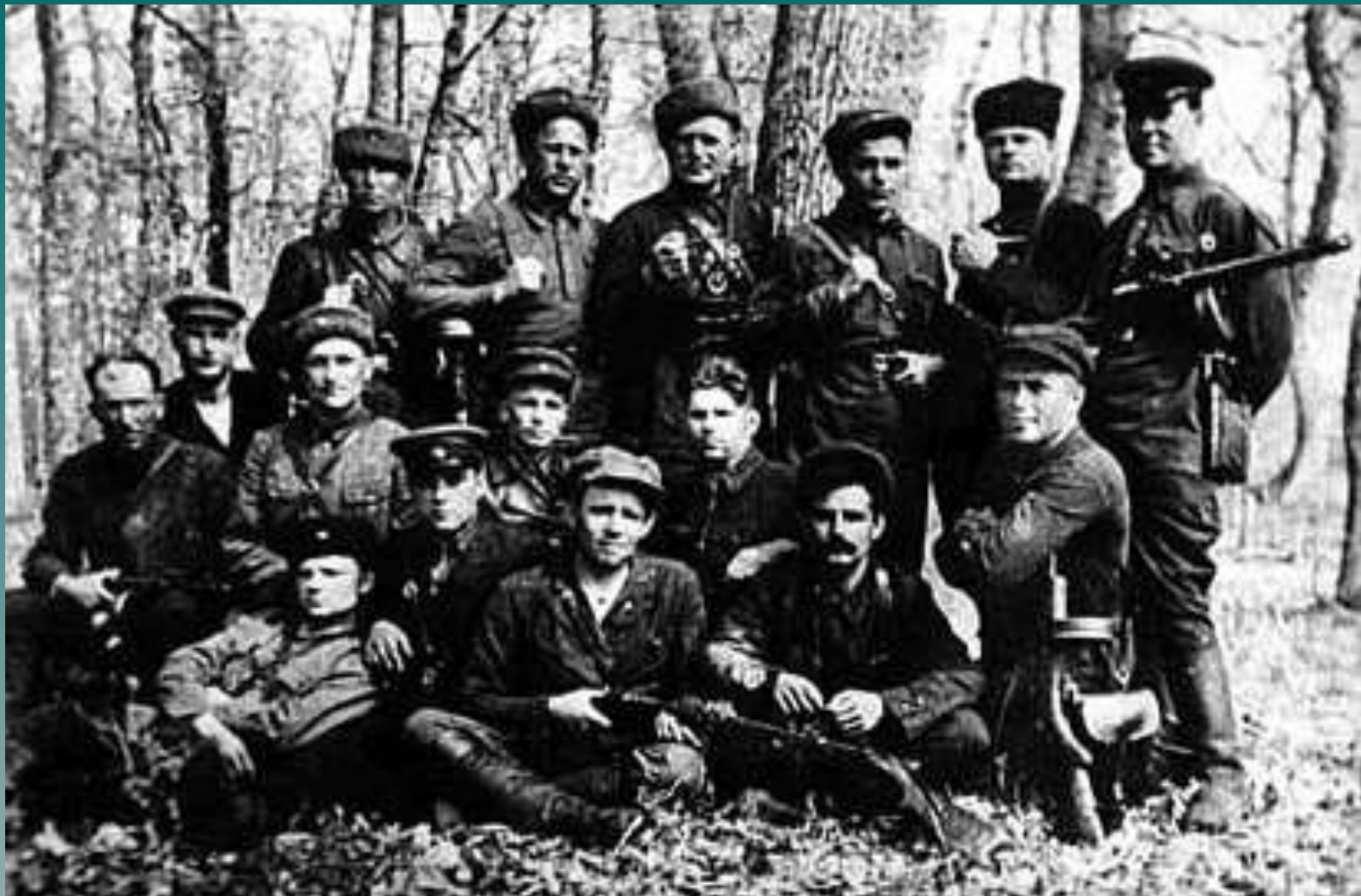
Бойцы партизанского отряда «Победители».