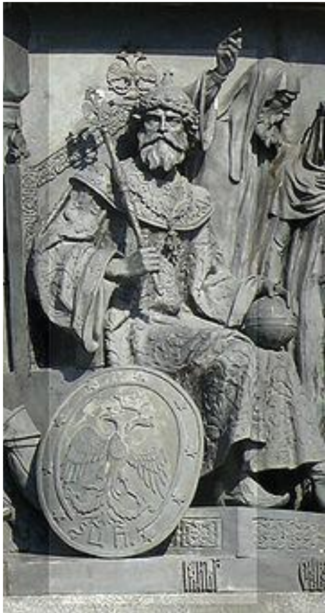
Иван III на Памятнике «1000-летие России» в Великом Новгороде.