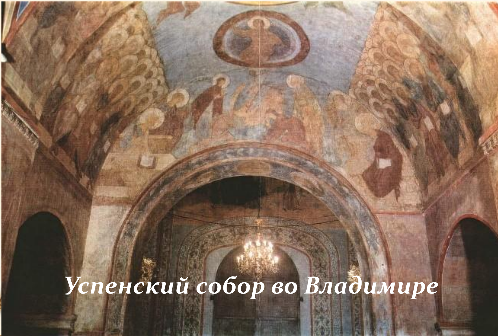
Успенский собор во Владимире