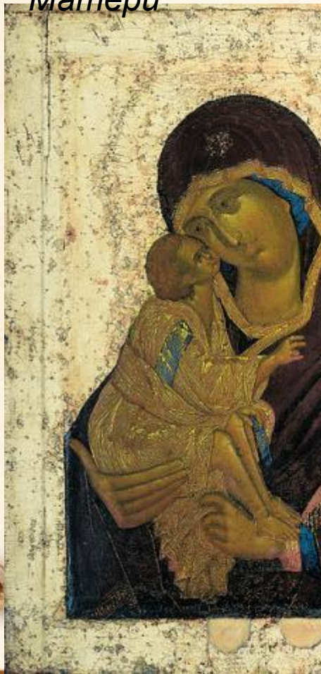
Донская икона Божьей Матери