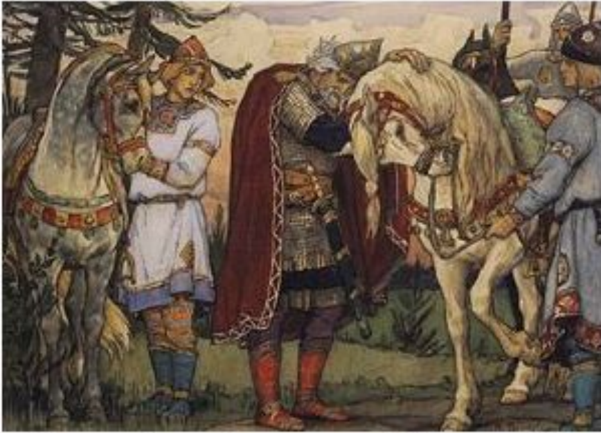
Прощание Вещего Олега с конем. В. Васнецов, 1899