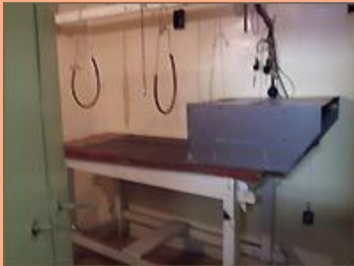
Камера в башне Молчания

Подача условных раздражителей производилась путем нажатия клавиш специального пульта. подача подкрепления производилась путем нажатия на баллон, соединенный резиновой трубкой с механизмом, обеспечивающим поворот чашек в кормушке с мясо-сухарным порошком. Наблюдение за поведением собаки производилось через перископ.