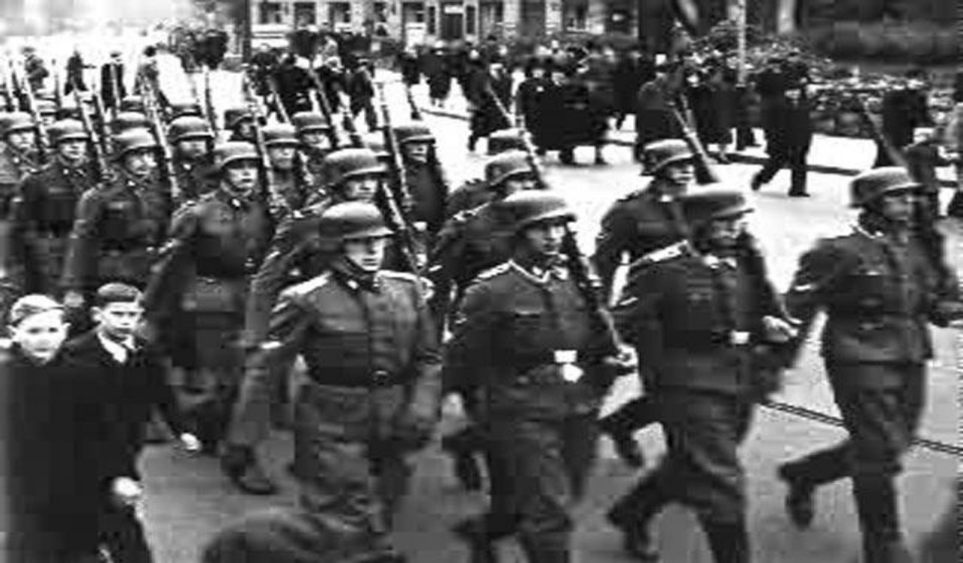
Легион латышских националистов «Латышские стрелки» на параде в Риге.