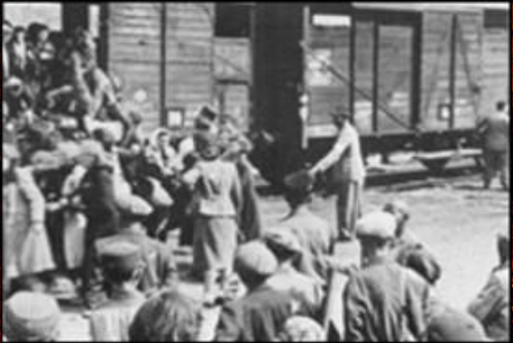
Депортация чеченцев и ингушей.