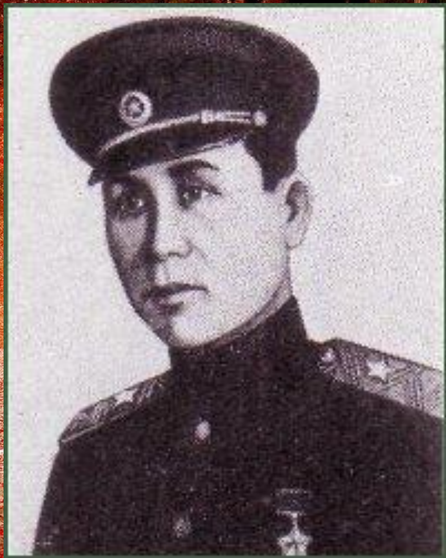
Гвардии генерал-майор, Герой Советского Союза Сабир Рахимов, командующий армией Белорусского фронта.