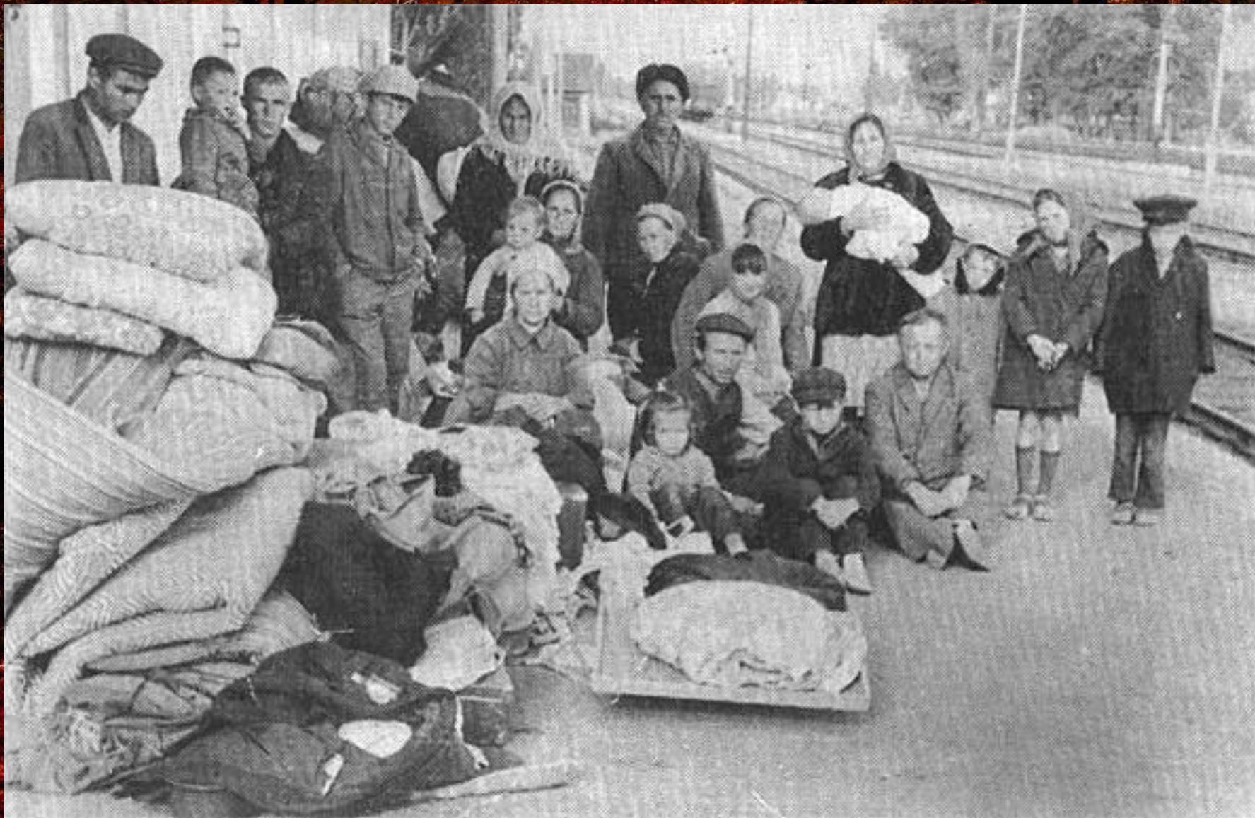
В ожидании депортации. Крымские татары.