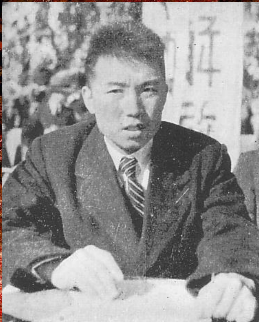
Ким Ир Сен, майор, командир батальона 88-ой отдельной стрелковой бригады. В будущем президент Северной Кореи.