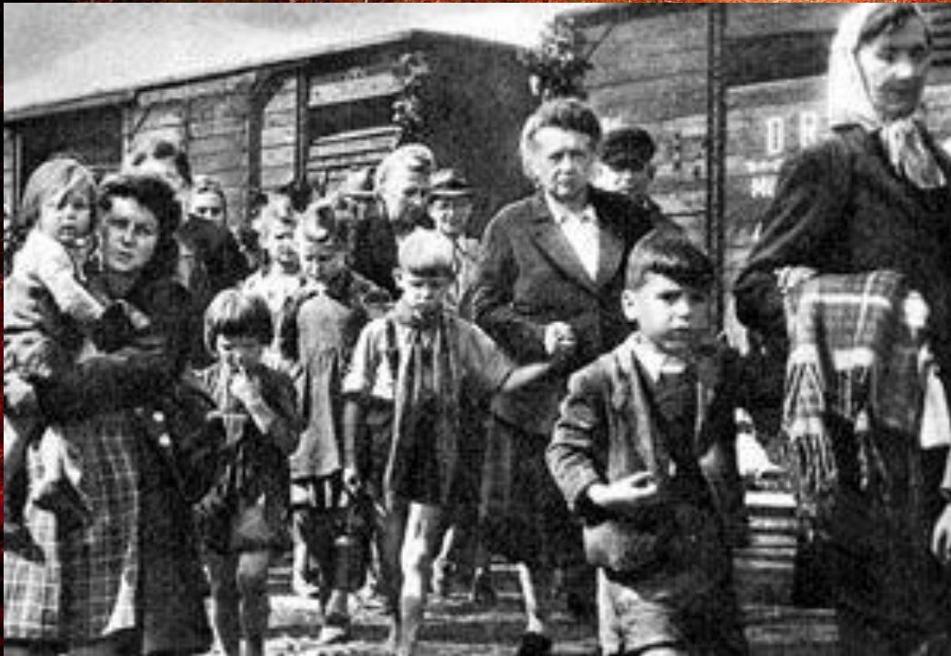
Ожидание депортации. Немцы Поволжья на станции.

Активизация национальных движений привела к ужесточению национальной политики. Летом 1941 г. «диверсантами и шпионами» объявили немцев Поволжья.(1,5 млн. чел.) и выслали в Сибирь и Казахстан. Тогда же по тому же обвинению депортировали в Сибирь 50 тыс. литовцев, латышей, эстонцев. В октябре 1943 г. в Казахстан и Киргизию выселили 70 тыс. карачаевцев, а в Сибирь 93 тыс. калмыков, 40 тыс. балкарцев. Многих снимали прямо с фронта несмотря на посты и звания и также депортировали. 23 февраля 1944 г. на Восток отправили 650 тыс. чеченцев и ингушей, а в мае 1944 г. в Узбекистан отправили 180 тыс. крымских татар. В результате депортации десятки тысяч погибли в пути.