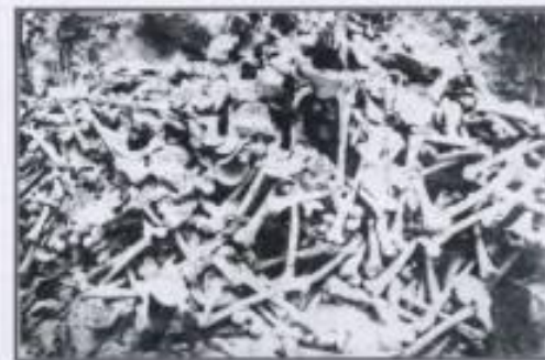
Фото 14 – ОСТРОВКИ (OSTROWKI) и ВОЛА ОСТРОВИЦКА (WOLA OSTROWIECKA), уезд Люблин, повстанчество летнее Август 1992

Результат проведенной 17 – 22 августа 1992 года массовой раскопки жертв массовой резни поляков, произошедшей в районе Островки и Воля Островицка, совершённой террористами ОУН – УПА (OUN – UPA). Украинские источники из Киева с 1988 года объявляют об общей количестве жертв в двух перечисленных селах 2 000 поляков.