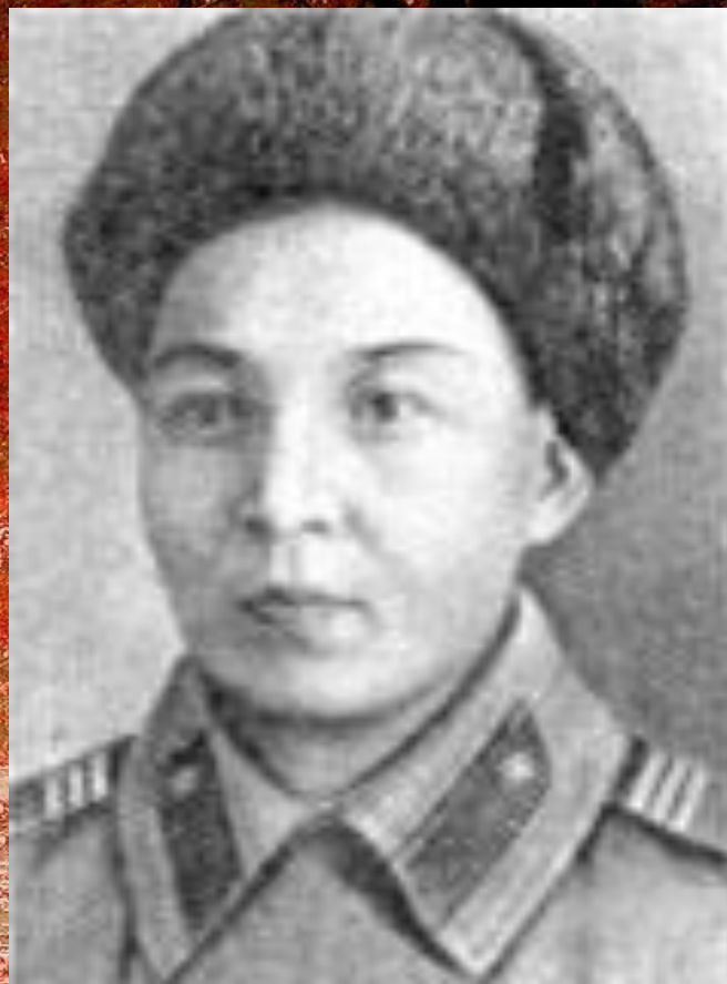
Мамётова Маншук пулемётчица 21-й гвардейской стрелковой дивизии 3-й ударной армии Калининского фронта, гвардии старший сержант. Первая казахская женщина, которой было присвоено звание Герой Советского Союза.