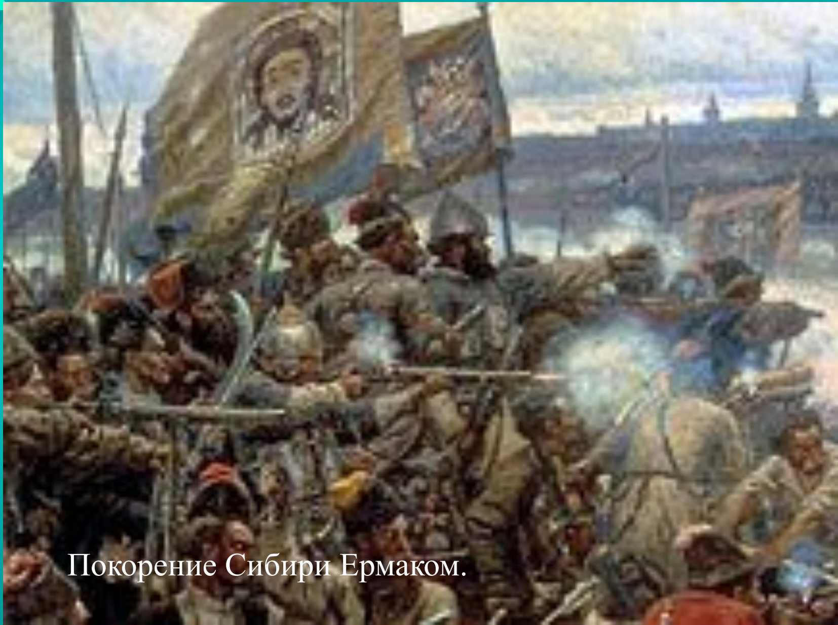
Покорение Сибири Ермаком.