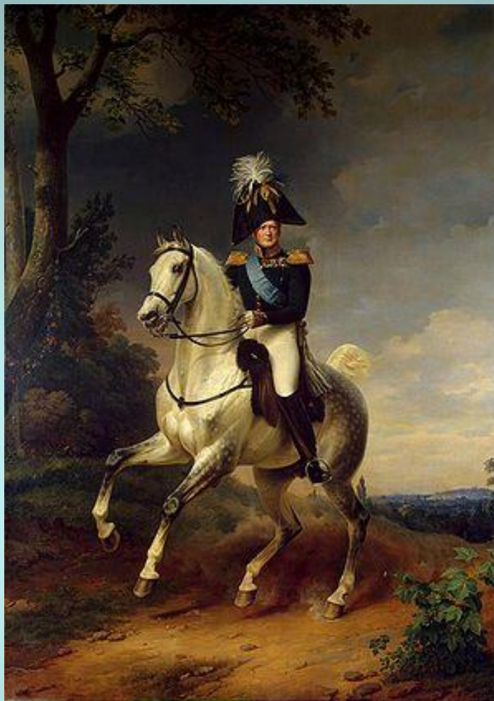
Франц Крюгер. Портрет Александра I верхом на коне.