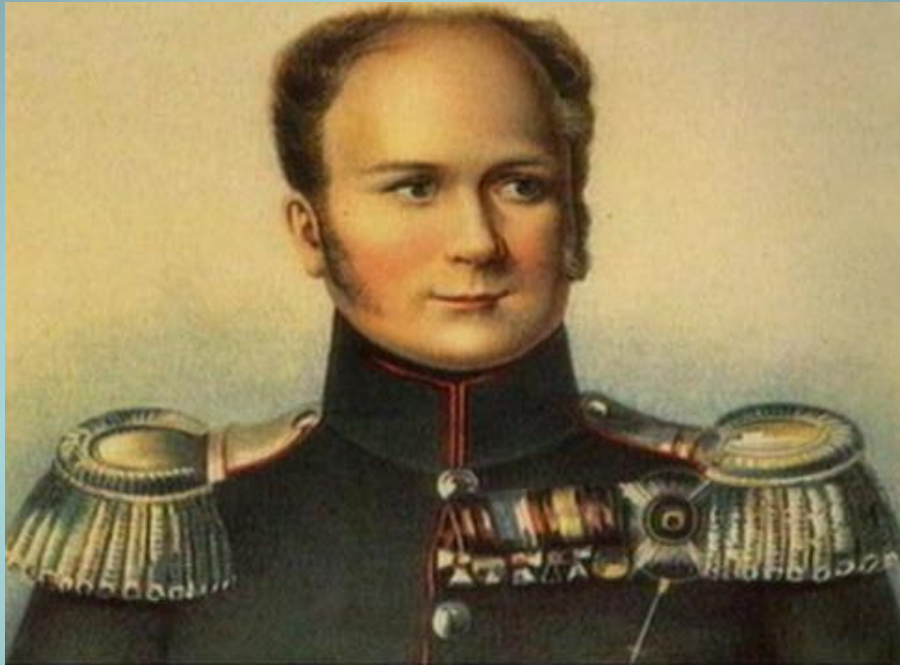
Александр I. Портрет неизвестного художника