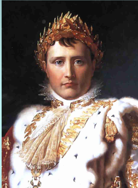
Наполеон Бонапарт, портрет работы Франсуа Жерара