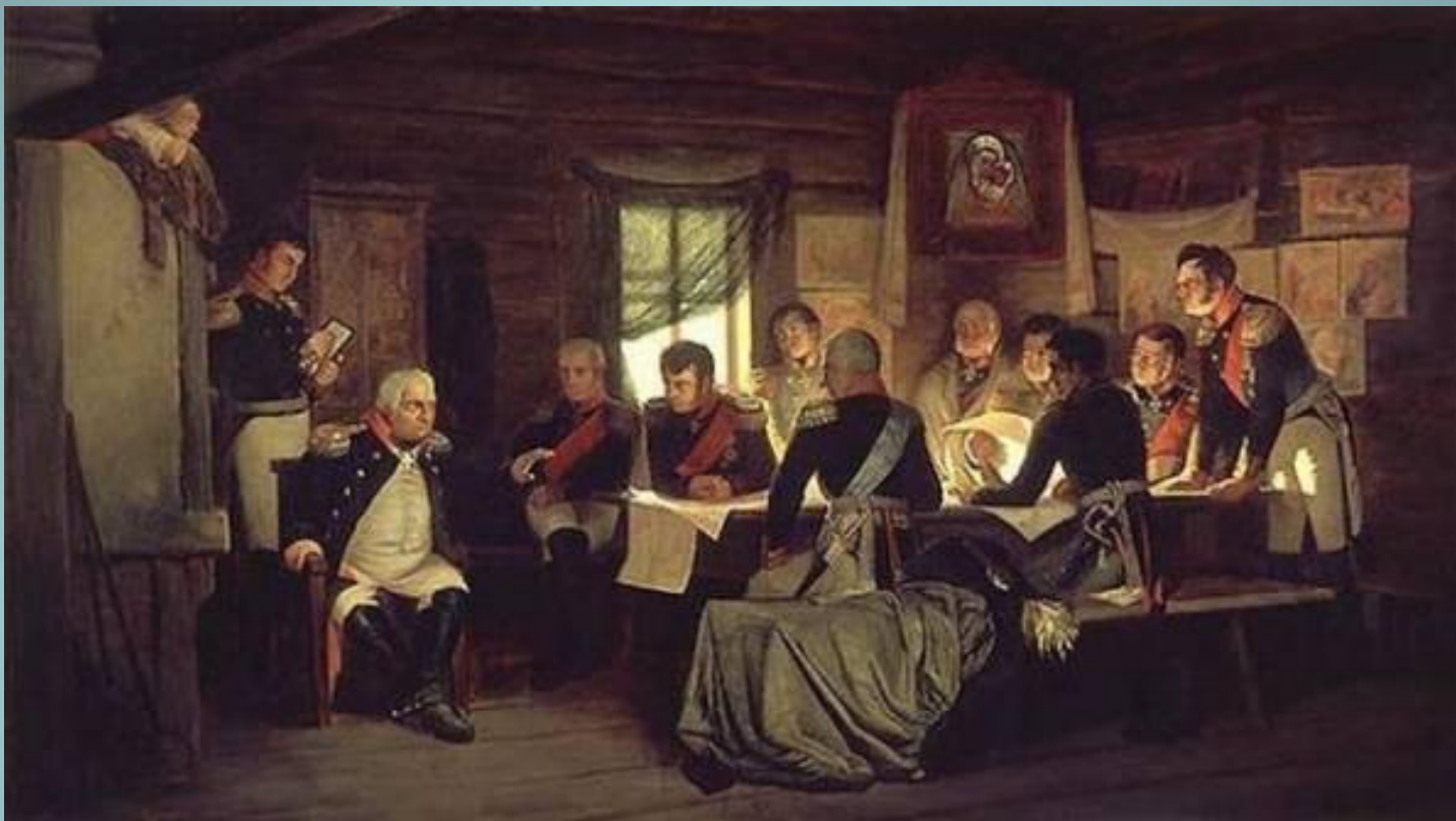
Военный совет в Филях. Художник А.Д. Кившенко. 1880 г.