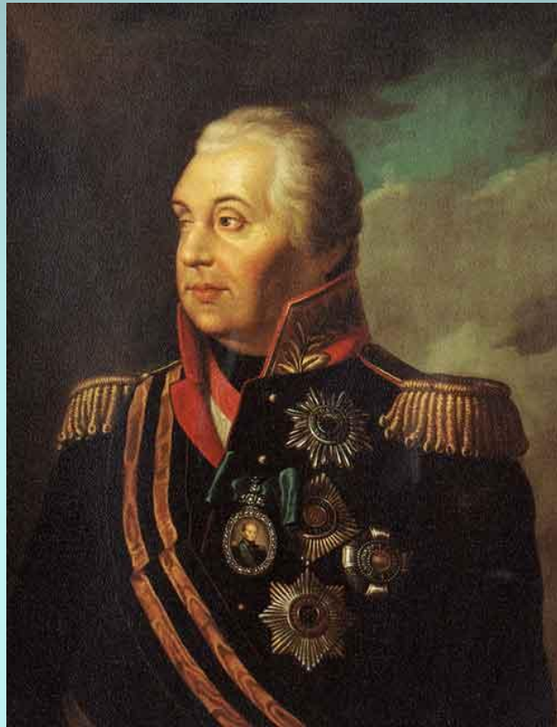
Художник Р. Волков. М.И.Голенищев-Кутузов. 1813 г.