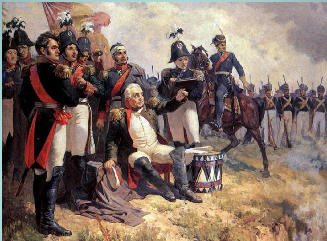
Художник А. Шепелюк. М.И. Кутузов на командном пункте в день Бородинского сражения