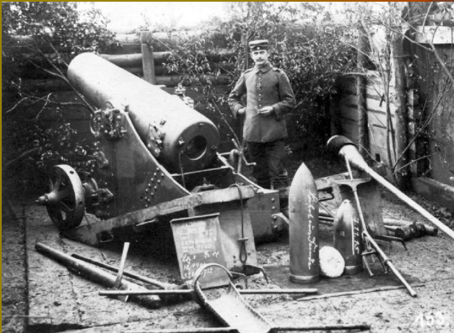
Окоп для орудия. (Английские войска, 1916 год)