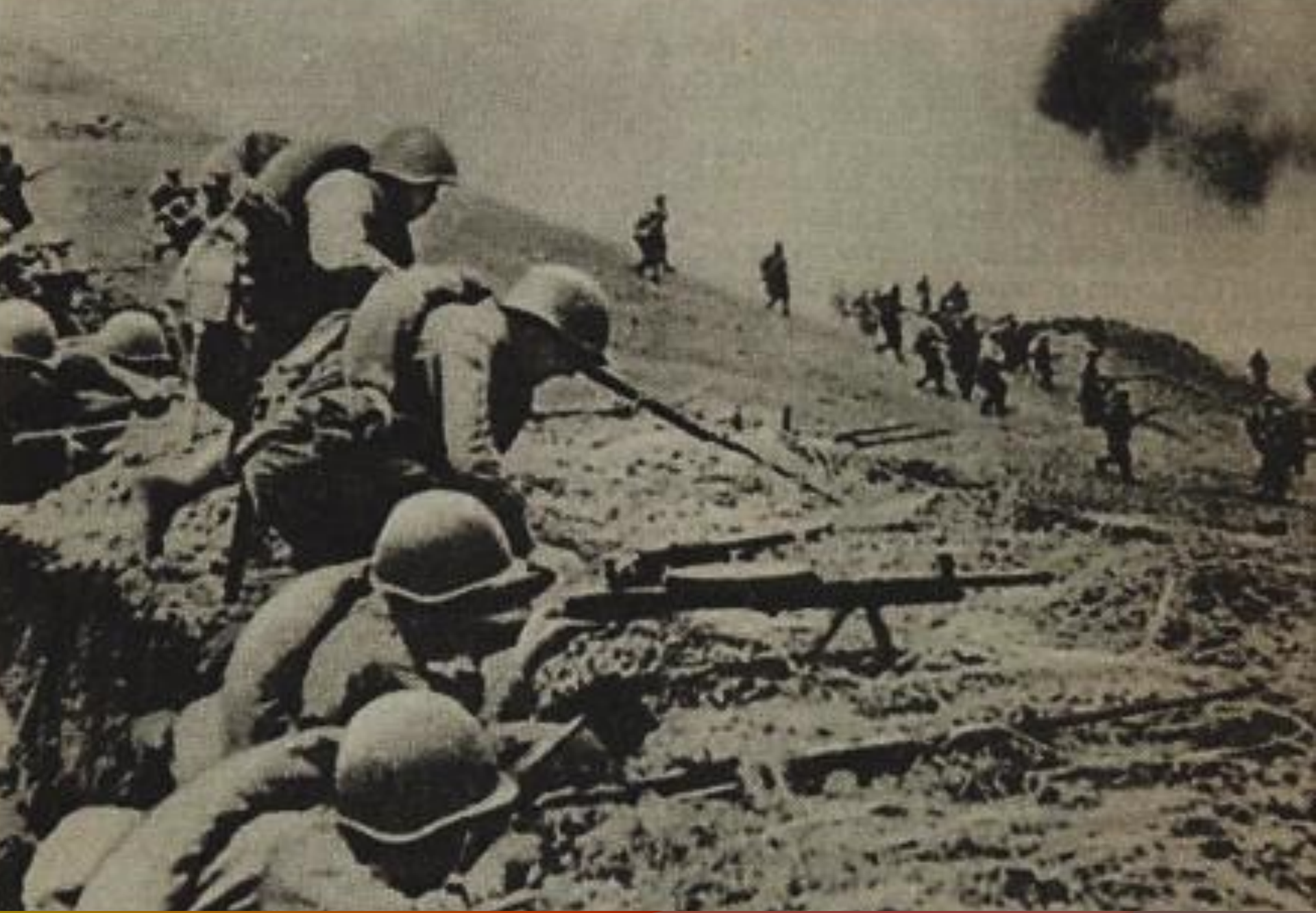
Из окопов поднимались в атаку