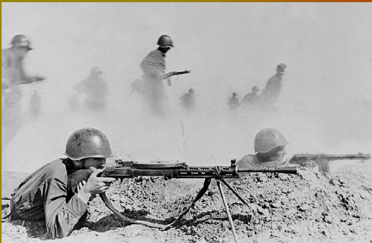
Бой на Сталинградском направлении. Лето 1942 года.