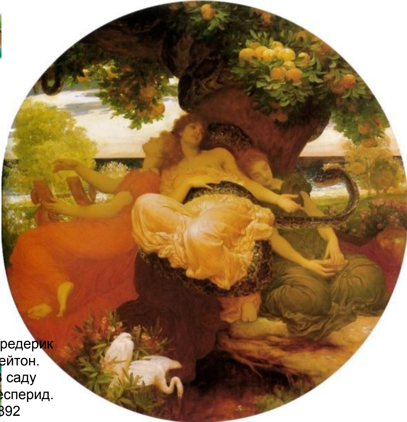
Фредерик Лейтон. В саду Гесперид. 1892