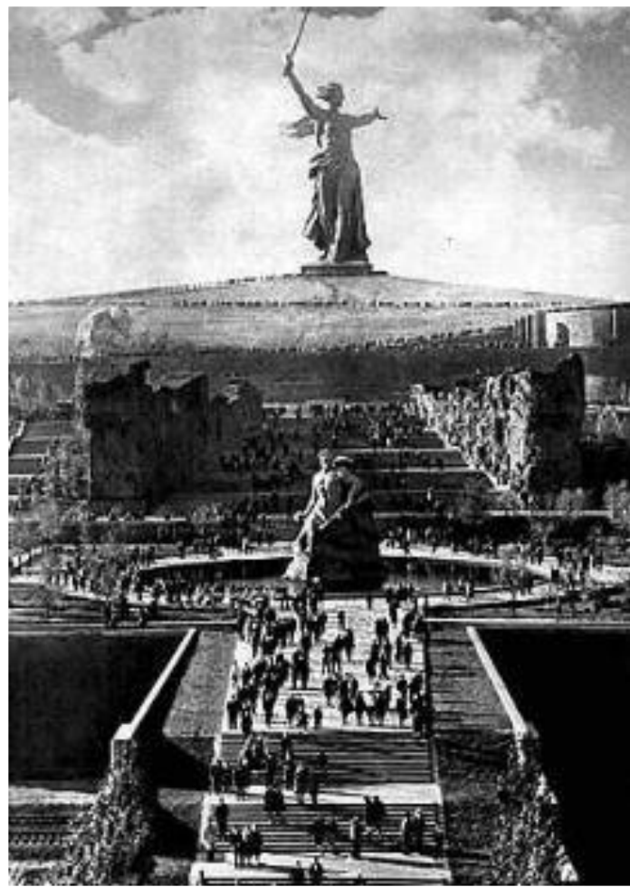
В. Вучетич. Комплекс на Мамаевом кургане.

Советский балет ставший лучшим в мире гордился М.Плисецкой, М.Ли епой, В.Васильевым, Н. Павловой, в то же время остались за границей и получили там признание Р.Нуриев, М. Барышников, А.Годунов. оперное искусство было представлено И. Архиповой, В.Атланотым, З.Соткилавой, Е. образцовой, Т. Синявской, Б. Штоколовым.