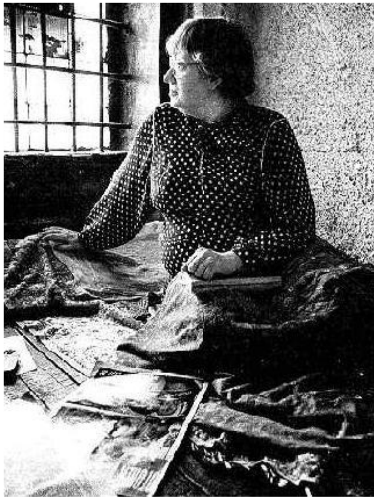
В.Новодворская в тюрьме.

Солженицын выступал за возрождение национального государства.