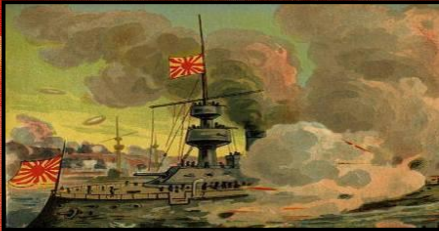
Морское сражение у Чемульпо. Литография, 1904 г.