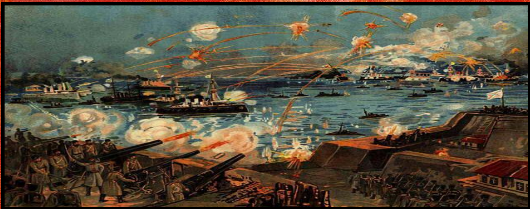
Морское сражение у Порт-Артура. Литография, 1904 г.

Душой обороны крепости был талантливый военачальник генерал Роман Кондратенко. Он понимал, что, пока держится Порт-Артур и сохранён флот, Россия может рассчитывать на победу в войне, поэтому делал всё возможное, чтобы отстоять крепость. 2 декабря Кондратенко погиб. Вскоре после этого начальник Квантунского укрепленного района Стессель, невзирая на протесты многих офицеров и недовольство солдат, подписали акт о капитуляции, хотя возможности обороны не были исчерпаны. 157 дней держалась крепость. Она отвлекала огромные силы противника, не давая ему возможности продолжить наступление в Маньчжурии. В боях за Порт-Артур погибли многие представители старинных самурайских принцев. Немалые потери понес при осаде и неприятельский флот. Падение Порт-Артура вызвало взрыв негодования в России, приблизив начало первой русской революции.»